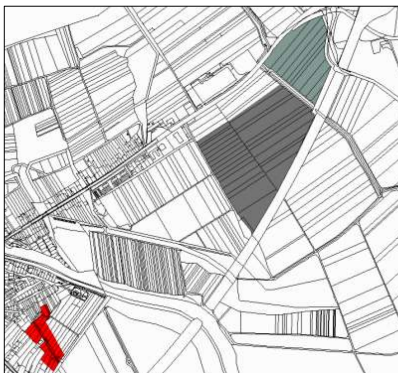
Schéma zastavitelných ploch zařazených do 2.etapy (k.ú. Pohořelice nad Jihlavou):