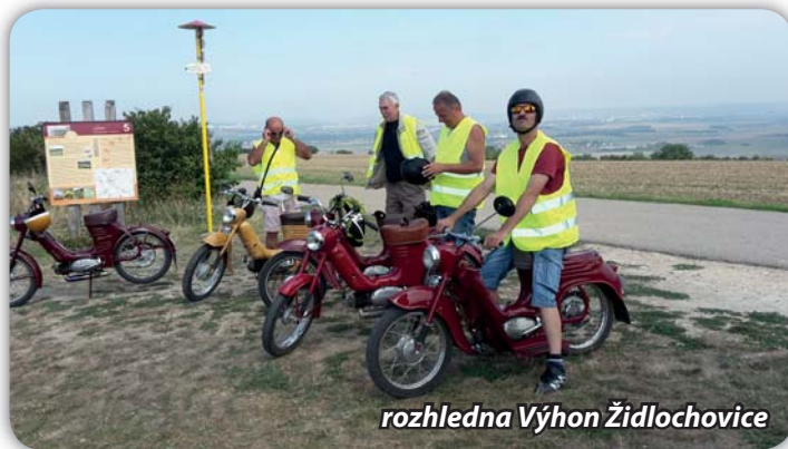
rozhledna Výhon Židlochovice