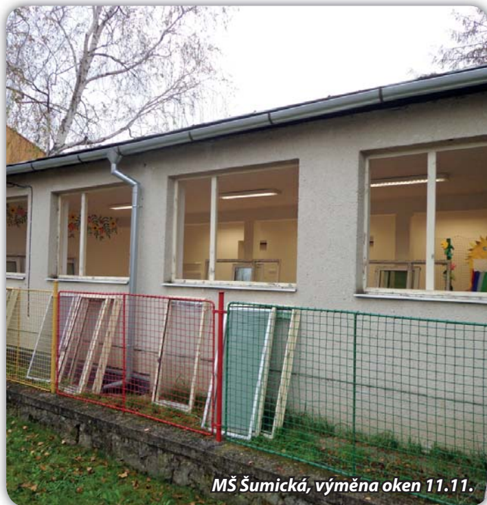
MŠ Šumická, výměna oken 11.11.