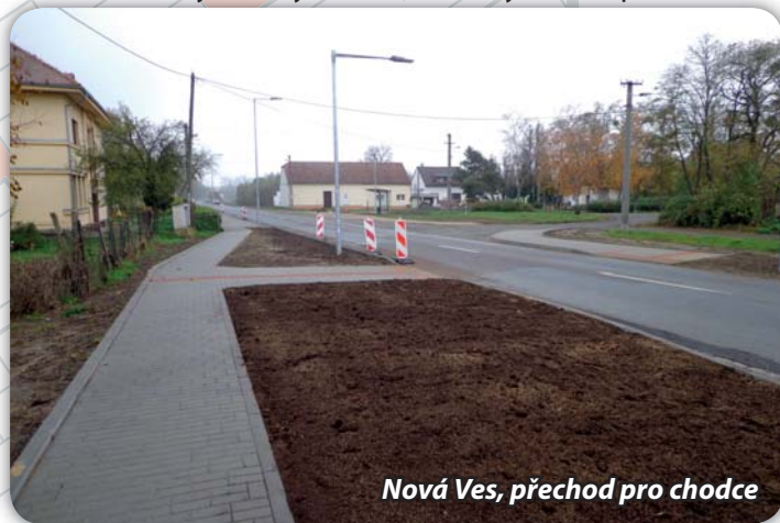
Nová Ves, přechod pro chodce

V srpnu t.r. zahájila společnost Silnice Škrob práce vedoucí k postavení přechodu pro chodce v Nové Vsi, v blízkosti bývalé mateřské školy. Stavba stála asi 3 miliony korun, stavebně je dokončena. Po obdržení souhlasu dopravní policie budou osazeny značky a na vozovce vyznačen přechod.