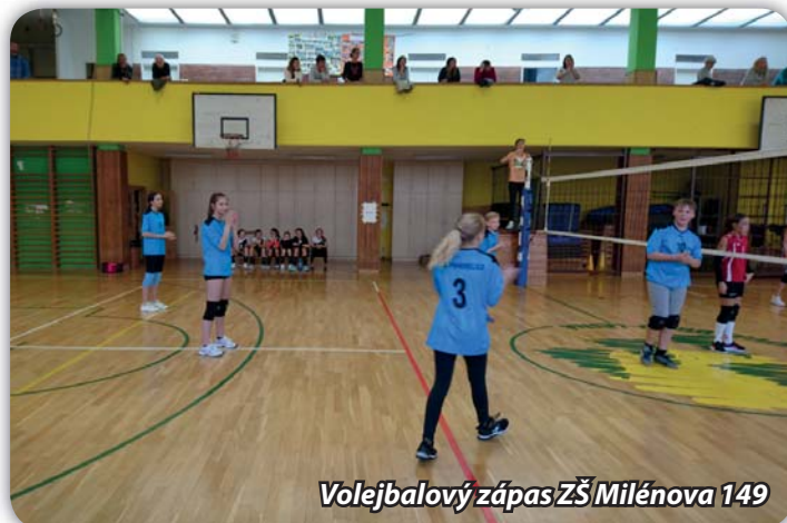
Volejbalový zápas ZŠ Milénova 149