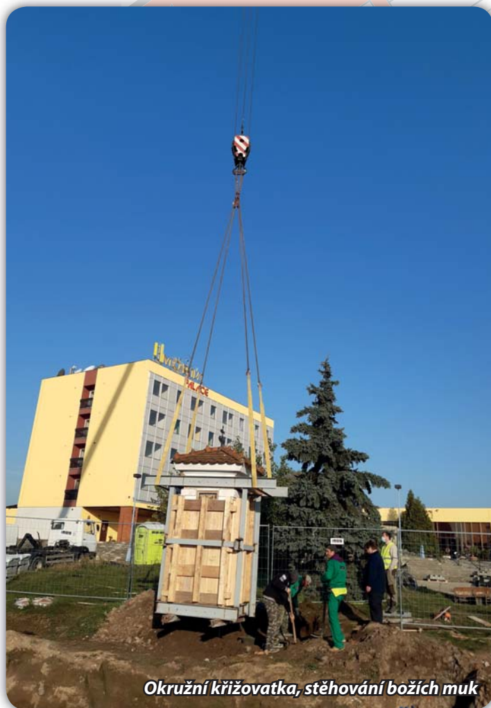
Okružní křižovatka, stěhování božích muk

V červenci začala společnost IMOS Brno s výstavbou okružní křižovatky. Financování stavby je vícezdrojové. Stavební objekty, které se týkají krajských komunikací, bude hradit Jihomoravský kraj. Opravu ulice Sportovní, stavbu parkovacích míst na téže ulici a odvedení dešťových vod hradí město. Z městských prostředků bude hrazena částka cca 20 mil. Kč. Firma provedla přeložky některých inženýrských sítí, 22.10. byla přestěhována boží muka na nové stanoviště. Ve dnech 11.-14.11. byla prováděna pokládka živice na severní straně budoucího objezdu. Touto stranou bude směřován silniční provoz až do ukončení prací. Od 18.11. je v provozu obchodní dům TESCO, i když přístup pro zákazníky i zásobování je poněkud komplikovaný (kolem hřbitova a fotbalového stadionu – na semafor). Věříme, že počasí dovolí zhotoviteli v prosinci dokončit stavbu.