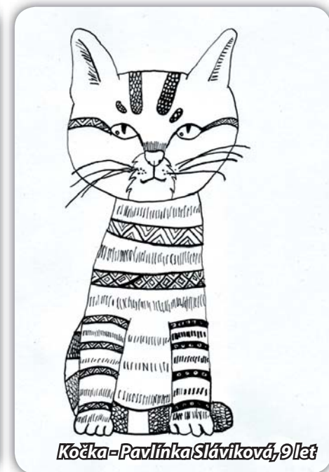
Kočka - Pavlínka Sláviková, 9 let