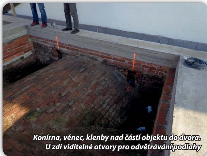
Konírna, věnec, klenby nad částí objektu do dvora. U zdi viditelné otvory pro odvětrávání/podlahy

Opravu Konírny provádí společnost Winning PS – stavební firma. Jedná se o výměnu střechy, vyklizení půdy, zpevnění kleneb, dozdivky poškozeného zdiva. Práce potvrjví do zimy. Po přeložení elektrického vedení ze štítu budovy směrem do Pšeničné bylo možné odstranit vyzdžený štít a dokončit věnec na obvodových zdech. V době vydání Zpravodaje by pracovníci firmy Strekon měli stavět krovy a následně pokládat krytinu.