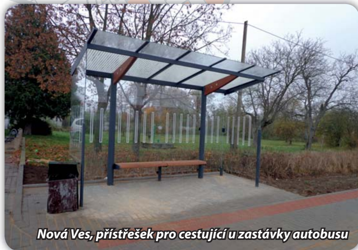
Nová Ves, přístřešek pro cestující u zastávky autobusu