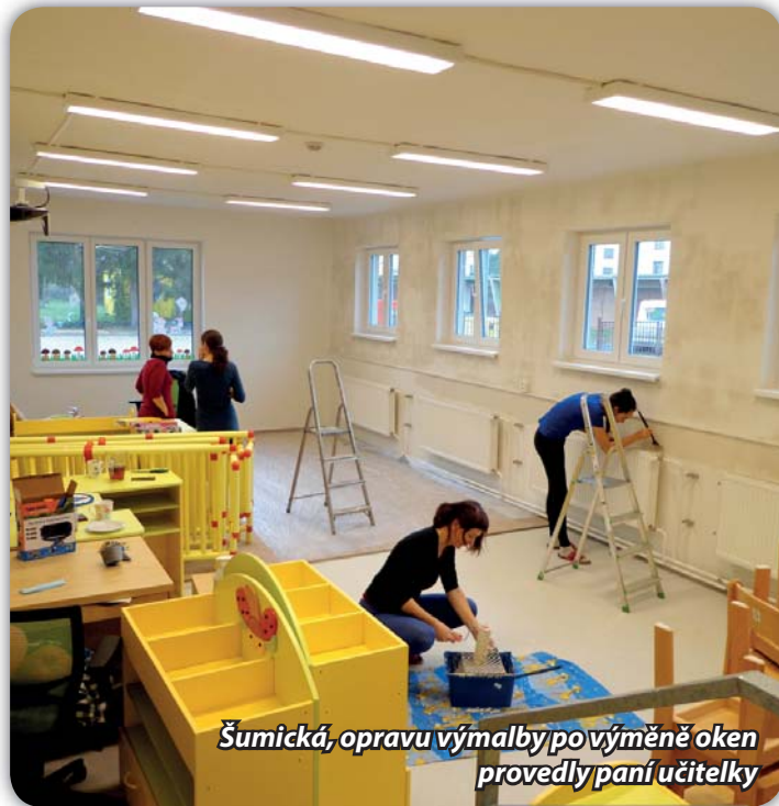
Šumická, oprava výmalby po výměně oken provedly paní učitelky

Okna v objektu bývalé zvláštní školy byla původní a měla velké tepelné ztráty. Současně jejich stav neumožňoval bezpečné otvírání a větrání některými křídly. Proto bylo přistoupeno k výměně oken. Akci provedla společnost Oknium, zapravení omítek zajistili pracovníci firmy Zborovský-Zajíc.