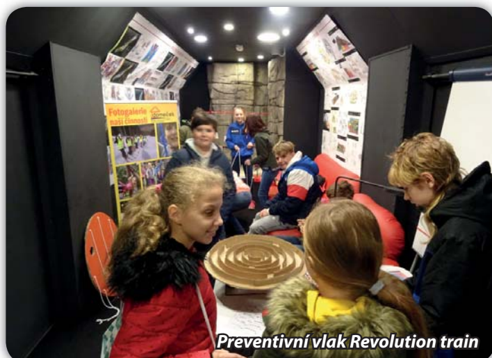
Preventivní vlak Revolution train