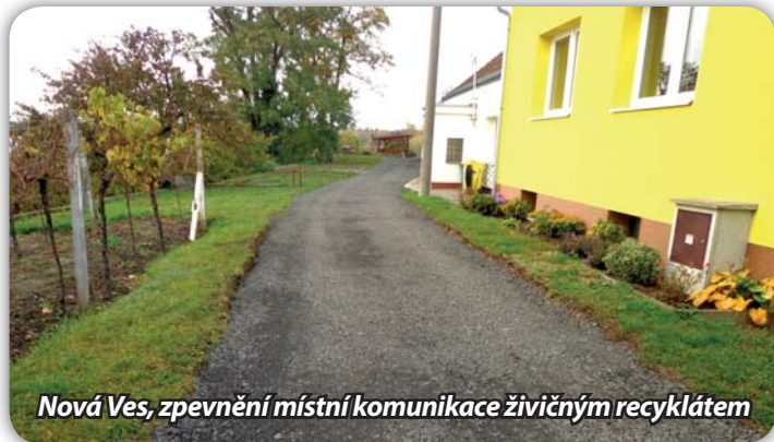
Nová Ves, zpevnění místní komunikace živičným recyklátem

Od společnosti Porr, která provádí výměnu povrchu části silnice I/52 v úseku Proklata – hřbitov v Nové Vsi, jsme dostali nabídku na odběr živičného recyklátu. Ten jsme využili na částečné zpevnění některých cest v Nové Vsi. Práce již