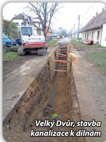
Velký Dvůr, stavba kanalizace k dílnám

Společnost Vodovody a kanalizace Břeclav, a.s., (dále jen VaK) uspěla na Státním fondu životního prostředí ČR se žádostí o dotaci na vybudování splaškové kanalizace ve Velkém Dvoře. Práce provádí společnost IMOS. Stavba začala v červnu 2021, trvat bude asi 1 rok. Splaškové vody z Velkého Dvora budou výtlačkem dopravovány na ulici Mlýnskou, pak potěčou gravitačně na ČOV. V současné době se hloubí výkop na komunikaci k „dílnám“ a trasa směr „zámek“. Při budování kanalizačního řadu směrem k hřišti a v Mariánském dvoře bude třeba po dobu kopání vyloučit v těchto úsecích dopravu včetně autobusové. Tyto práce budou občanům s předstihem avizovány. Začnou zřejmě v průběhu ledna 2022.