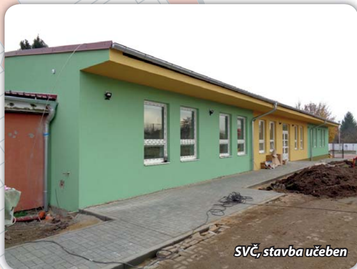
SVČ, stavba učeben

V červnu byla zahájena výstavba 2 učeben pro mimoškolní aktivity v areálu SVČ na Dlouhé ulici. Stavbu provádí společnost STAVIKA z Břeclavi. Dokončení stavby předpokládáme do konce roku. Investiční náklady činí cca 7 milionů Kč, z toho asi 2,7 mil. Kč pokryje dotace získaná prostřednictvím Místní akční skupiny Podbrněnsko.