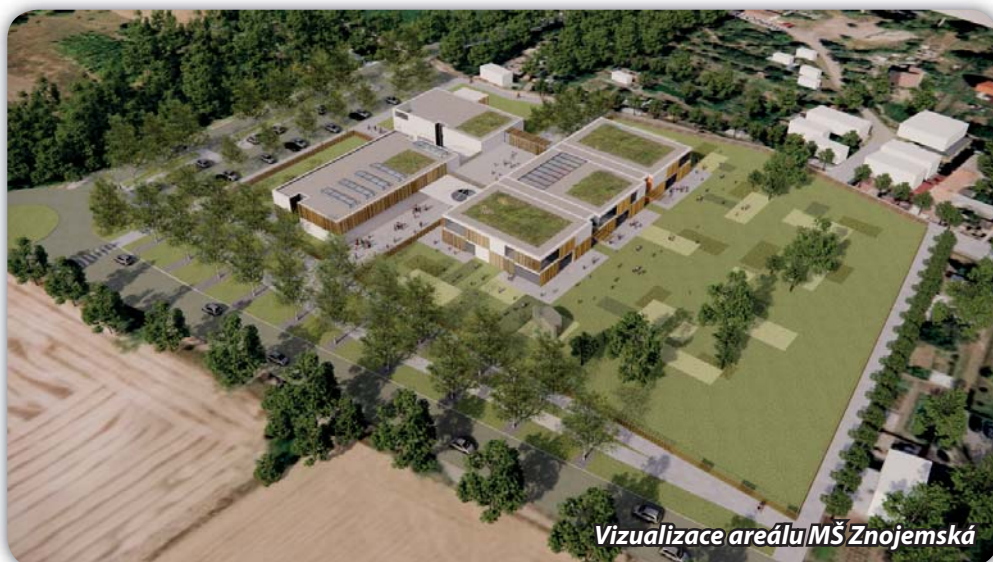
Vizualizace areálu MŠ Znojemská