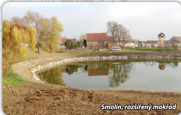
Smolín, rozšířený mokřad

Mokřad je vyčištěn a rozšířen na zhruba dvojnásobek dřívější plochy. Zhotovitel firma Kavyl nyní postavila oplocenky a vysázela v nich dřeviny.