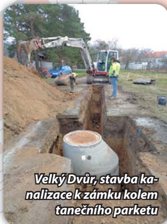
Velký Dvůr, stavba kanalizace k zámku kolem tanečního parketu