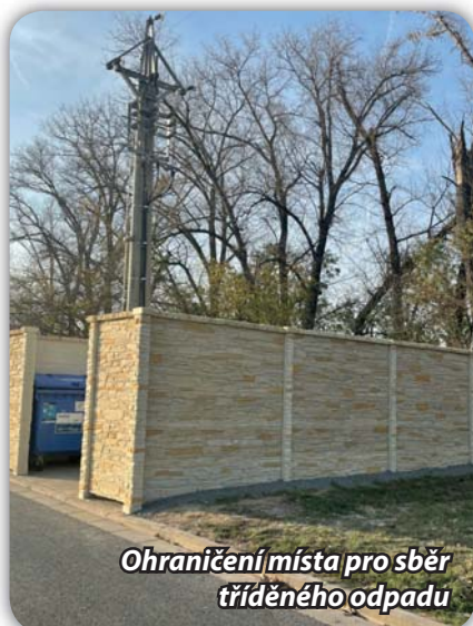
Ohraničení místa pro sběr tříděného odpadu

Neváhejte se obrátit na naše pracovníky. Bližší informace na webu města http://www.pohorelice.cz/dokumenty-a-formulare-fo nebo u vedoucí finančního odboru Ing. Lenky Forýtkové na telefonu 725 587 411.