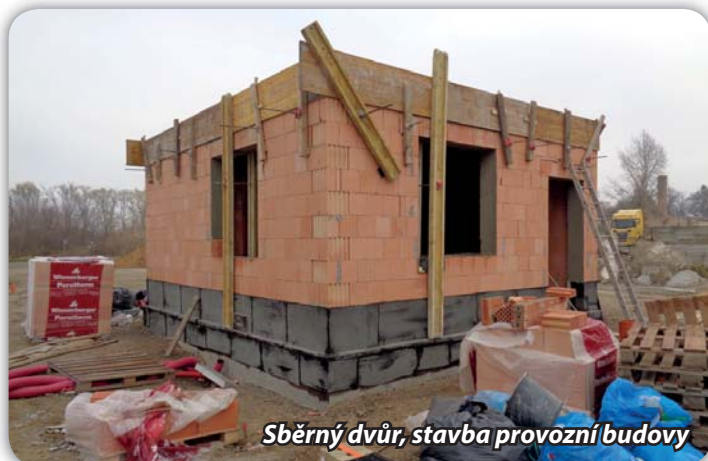
Sběrný dvůr, stavba provozní budovy

Stavbu provádí společnost SET stavby. Předpokládáme, že sběrný dvůr bude hotov v létě příštího roku.