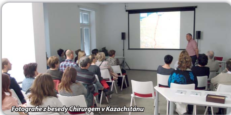
Fotografie z besedy Chirurgem v Kazachstánu