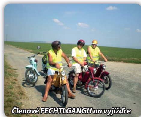
Členové FECHTLGANGU na vyjíždě