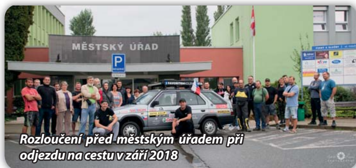
Rozloučení před městským úřadem při odjezdu na cestu v září 2018