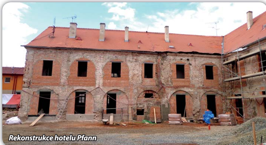
Rekonstrukce hotelu Pfann