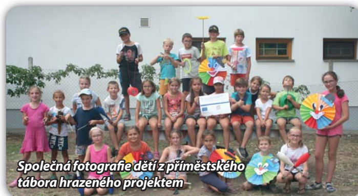
Společná fotografie dětí z příměstského tábora hrazeného projektem

Evropská unie Evropský sociální fond Operační program Zaměstnanost