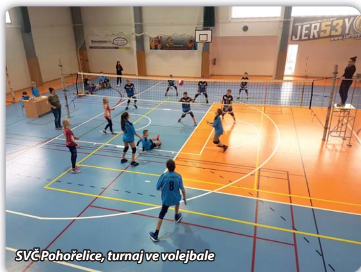
SVČ Pohorelice, turnaj ve volejbale