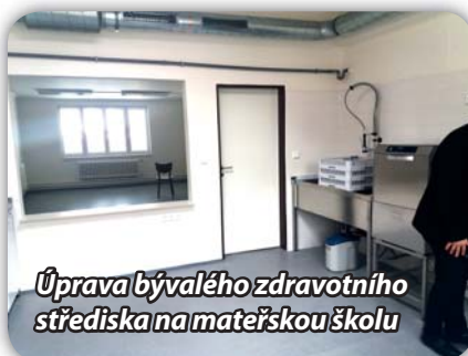
Úprava bývalého zdravotního střediska na mateřskou školu