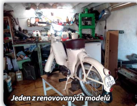
Jeden z renovovaných modelů