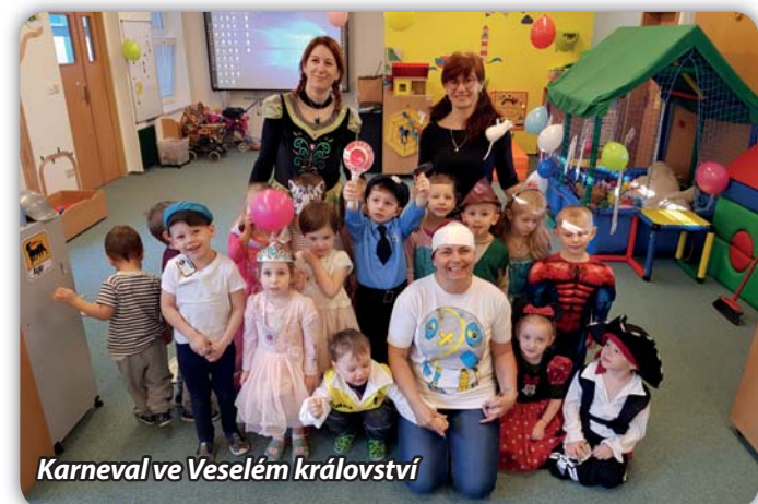
Karneval ve Veselém království