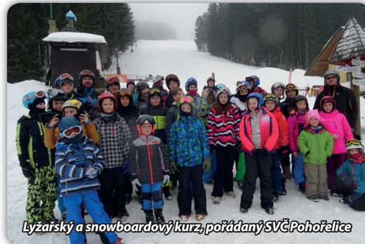
Lyžařský a snowboardový kurz, pořádaný SVČ Pohorelice

Pohorelický zpravodaj - periodický tisk územního samosprávného celku. Vydává město Pohorelice IČO: 0028359509.