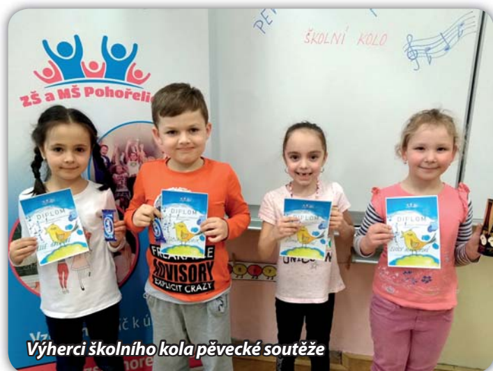
Výherci školního kola pěvecké soutěže