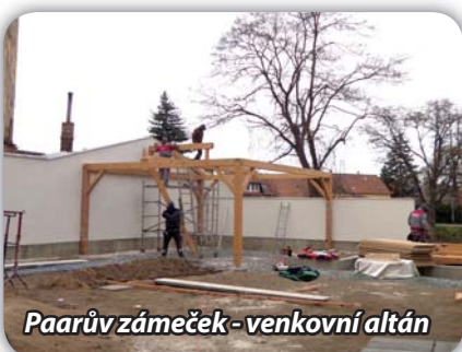
Paarův zámeček - venkovní altán