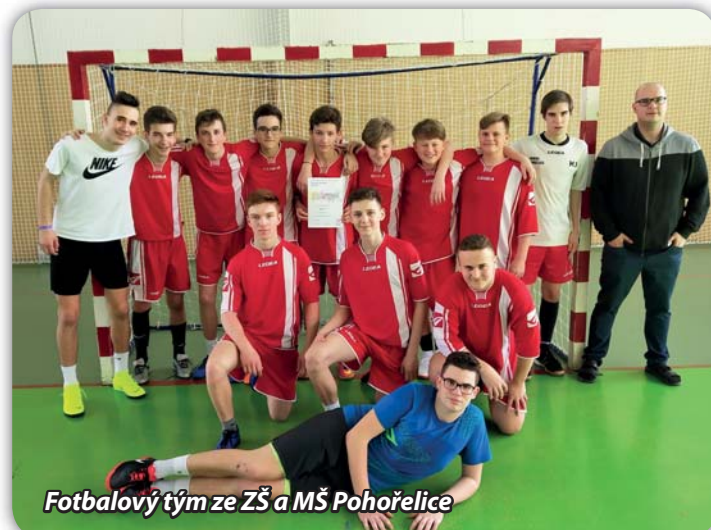
Fotbalový tým ze ZŠ a MŠ Pohorelice