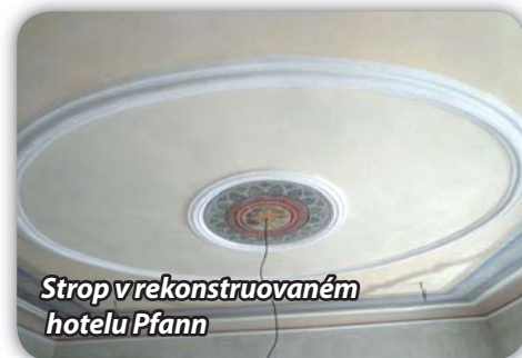
Strop v rekonstruovaném hotelu Pfann