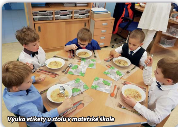
Výuka etikety u stolu v mateřské škole