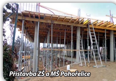
Přístavba ZŠ a MŠ Pohořelice