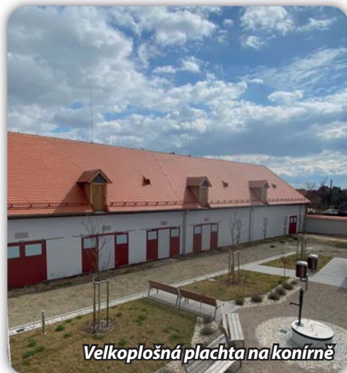
Velkoplošná plachta na konírně