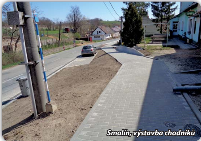
Smolín, výstavba chodníků

Společnost RONYTRANS začala s výstavbou chodníků ve Smolíně. Akce by měla být hotova v průběhu léta, náklady na zhotovení jsou cca 11,8 mil. Kč vč. DPH. Firma začala s budováním ve směru od hřiště do centra obce. V průběhu stavby se objevily problémy s dodržením sklonu chodníků a jejich návazností na stávající vstupy a vjezdy do domů. Nyní jsou upravovány pozemky vpravo od silnice při vjezdu do Smolína od Pohořelic spodní cestou.