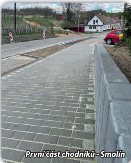
První část chodníků - Smolín