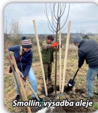
Smolín, výsadba aleje

zoval Smolínský spolek. Další akcí byla výsadba 61 ks lip, které budou tvořit alej podél polní cesty či pěšiny vedoucí ke kapli na vrcholu kopce. Brigádníci byli z řad občanů města a pracovníků městského úřadu. Celkem sázelo stromy více než 30 lidí a akce se zdařila. Věříme, že se stromy ujmou a budou po několika letech dávat ovoce, poskytovat stín lidem na procházce a včelám potravu. Všem zúčastněným děkujeme.