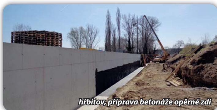
hřbitov, příprava betonáže opěrné zdi

Společnost VS Build ze Želešic staví opěrnou zídku pro rozšíření hřbitova v Pohořelicích. Stavba obsahuje hodně zemních a betonářských prací. Plochu k rozšíření bude třeba navýšit v průměru o 1,5 metru, dalších 1,6 metru bude tvořit zídka jako oplocení. Provádí se izolace, instalace výztuže a betonáž opěrné zídky. Stavba bude stát cca 5,5 mil. Kč vč. DPH.