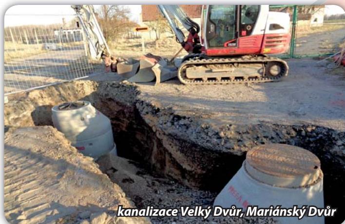
kanalizace Velký Dvůr, Mariánský Dvůr

Práce provádí společnost IMOS. Stavba začala v červnu 2021, trvat bude do konce roku 2022. Splaškové vody z Velkého Dvora budou výtlakem dopravovány na ulici Mlýnskou, pak potečou gravitačně na ČOV. IMOS prováděl výstavbu gravitační kanalizace u fotbalového hřiště ve Velkém Dvoře. Nyní se upřesňují délky a místa přípojek pro objekty. Silnice bude ještě rozkopána.