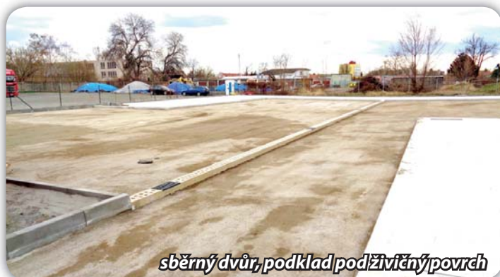
sběrný dvůr, podklad pod živičný povrch

Stavbu provádí společnost SET stavby. Předpokládáme, že sběrný dvůr bude hotov v létě. Firma třídí výkopovou zeminu, kterou skryla na dotčené ploše bývalé cukrovarské skládky. Staví dále sjezd ze silnice ke sběrnému dvoru a zpevněné plochy.