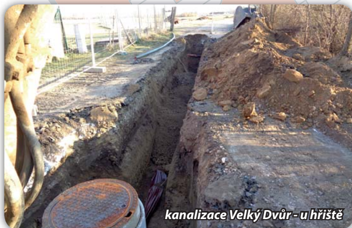
kanalizace Velký Dvůr - u hřiště