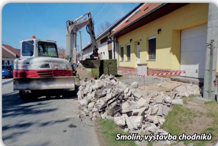
Smolín, výstavba chodníků