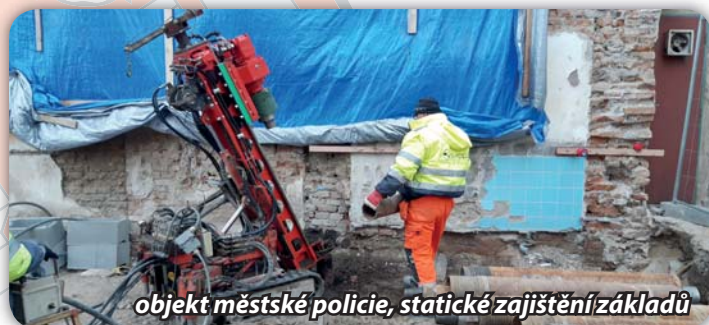
objekt městské policie, statické zajištění základů

V únoru t.r. začala postupná demolice domu na ulici Lidické, bezprostředně u zastávky autobusů. Dům byl ručně zdemolován. V dubnu prováděla specializovaná firma mikropiloty, které budou držet nový objekt.