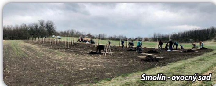
Smolín - ovocný sad