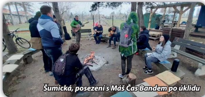
Šumická, posezení s Máš Čas Bandem po úklidu

Skauti zorganizovali spolu se členy Klubu seniorů a pétanque klubu úklid městského parku. Několik desítek brigádníků vysbíralo v parku odpadky a vše, co tam nepatří. Řada dalších lidí uklízela okolí svého bydliště. Odpoledne bylo možné se zúčastnit završení této akce – opékání špekáčků na Šumické ulici za hudby Máš Čas Bandu. Studený vítr řadu lidí od účasti odradil, přítomní si od srdce zazpívali. Rovněž děkujeme všem brigádníkům za práci a účast na akci.