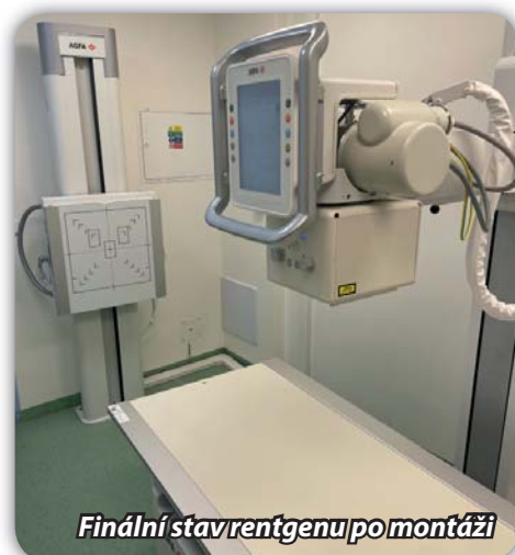
Finální stav rentgenu po montáži