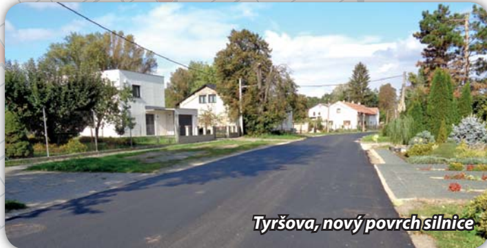
Tyršova, nový povrch silnice

Správa a údržba silnic avizovala provedení opravy povrchu na ul. Tyršova – od sokolovny až do Cvrčovic po první odbočku. Povrch silnice byl odfrézován a následně byl položen nový živícný povrch. Akce zvýšila bezpečnost silničního provozu a zlepšil se samozřejmě i vzhled města.