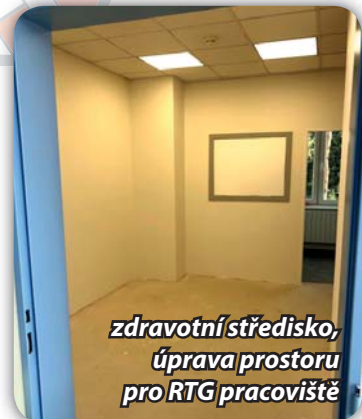
zdravotní středisko, úprava prostoru pro RTG pracoviště

Od léta se připravovaly prostory na zdravotním středisku pro instalaci rentgenu. Práce byly dokončeny, v polovině října nainstalován rentgen. Bližší údaje budou uvedeny v článku na jiném místě Zpravodaje.