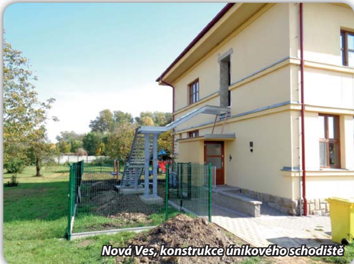
Nová Ves, konstrukce únikového schodiště

Stavební firma VS Build opravuje v Nové Vsi patro bývalé mateřské školy. Od podzimu v objektu působí jedna dětská skupina, v průběhu zimy pak bude otevřena další třída v patře. Na zahradě byly osazeny herní prvky, studna zprovozněna a osazeno čerpadlo k zalévání zeleně.