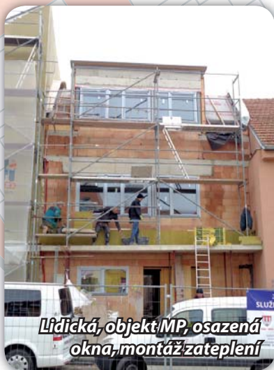
Lidická, objekt MP, osazená okna, montáž zateplení

Na stavbě byla osazena okna, pokračuje se v instalaci vnitřních rozvodů a provádějí se omítky. Stavební práce skončí do konce roku.