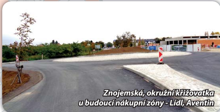
Znojemská, okružní křižovatka u budoucí nákupní zóny - Lidl, Aventin

Na ulici Znojemské buduje společnost Lidl supermarket. Byl postaven skelet prodejny, instaluje se technologie, dokončuje se propojení inženýrských sítí. Na sousední parcele zahájí stavbu prodejních jednotek společnost AVENTIN. Ta je též investorem stavby okružní křižovatky, která vznikla v místě odbočky k betonárně. Lidl obchodní jednotku otevře zřejmě v únoru 2023, AVENTIN bude zahajovat provoz v létě.