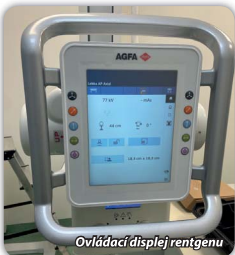
Ovládací displej rentgenu