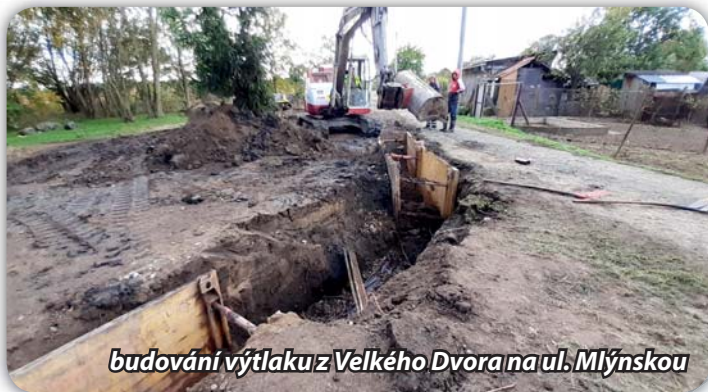
budování výtlačku z Velkého Dvora na ul. Mlýnskou

Firma ve Velkém Dvoře pokračuje v pracích u rodinných domků v areálu Rybníkářství. Připravuje se montáž technologie a zpevnění ploch u čerpacích stanic. Asi v polovině listopadu bude firma zapravovat živíci překopy na vozovkách.