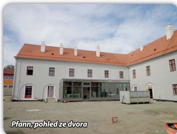
Pfann, pohled ze dvora