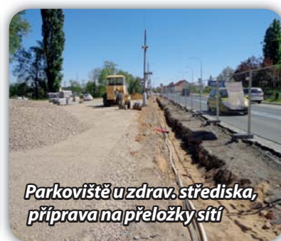
Parkoviště u zdrav. střediska, příprava na přeložky sítí