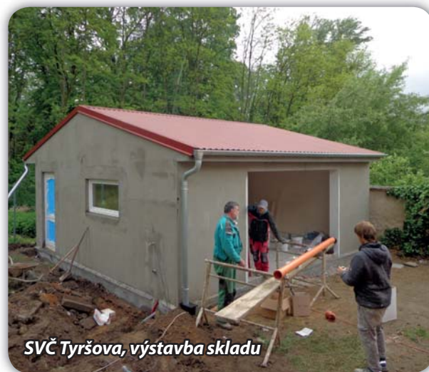
SVČ Tyršova, výstavba skladu