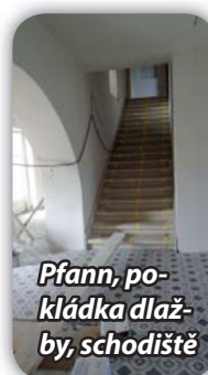
Pfann, pokládka dlažby, schodiště