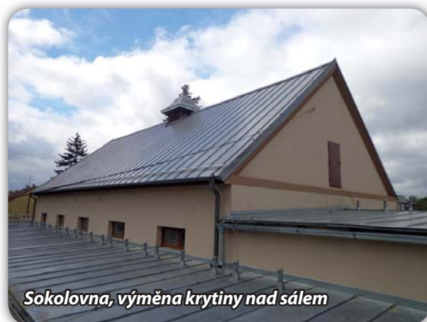
Sokolovna, výměna krytiny nad sálem