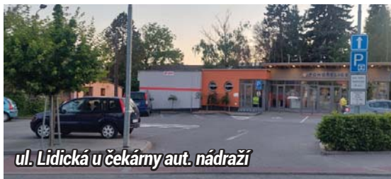
ul. Lidická u čekárny aut. nádraží