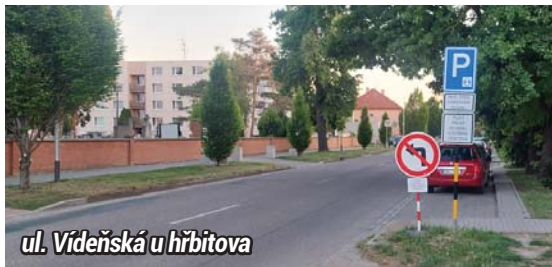
ul. Vídeňská u hřbitova