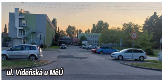
ul. Vídeňská u MěÚ