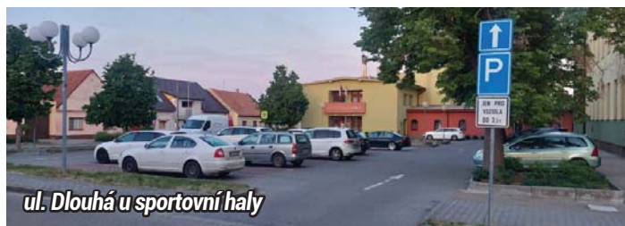
ul. Dlouhá u sportovní haly

Nezapomeňte na parkovací hodiny - ušetří vám starosti!