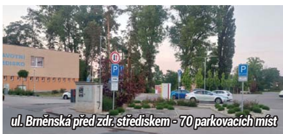
ul. Brněnská před zdr. střediskem - 70 parkovacích míst