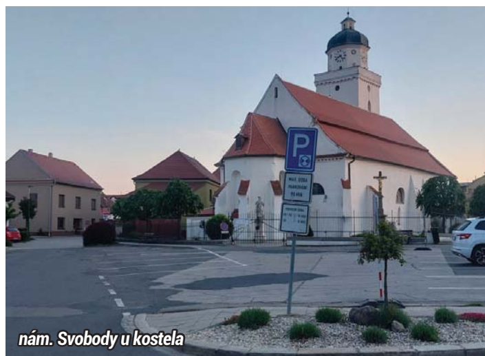
nám. Svobody u kostela