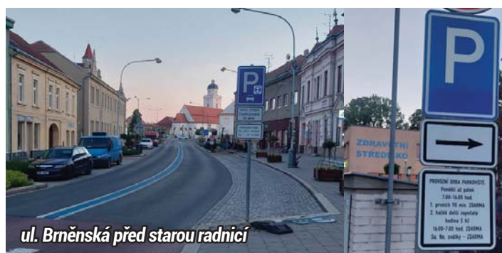
ul. Brněnská před starou radnicí