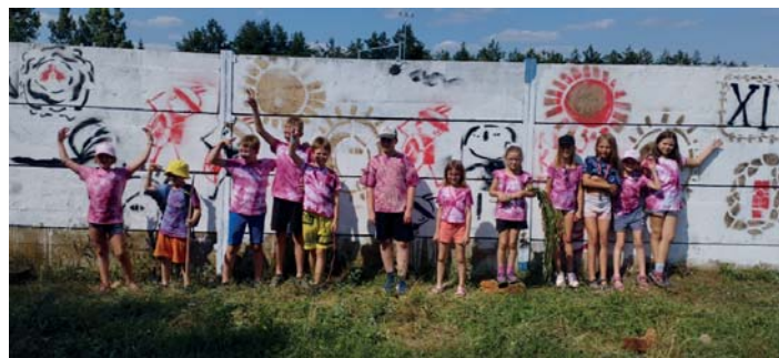
Děti z příměstského tábora