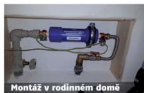
Montáž v rodinném domě