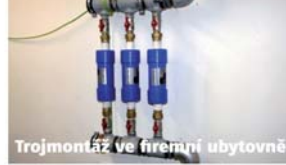
Trojmontáž ve firemní ubytovně