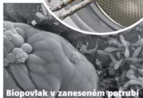
Biopovlak v zaneseném potrubí

Doživotní účinnost a záruky Úprava nevyžaduje žádný zdroj energie, pracuje bez údržby a bez obsluhy mnoho desítek let. Pracuje i tam, kde jiné systémy selhaly – jistotou pro vás je, že na každou úpravnu poskytujeme záruku vrácení peněz! Zdá se vám to zajímavé? Chcete zjistit více? Zavolejte zdarma! Zvedněte telefon a zavolejte na bezplatnou linku Geocentra : 800 100 731. Najdeme řešení pro váš dům, poradíme s montáží, zašleme test na změření tvrdosti vody a POZOR: upozorníme vás na mimořádnou možnost slevy.