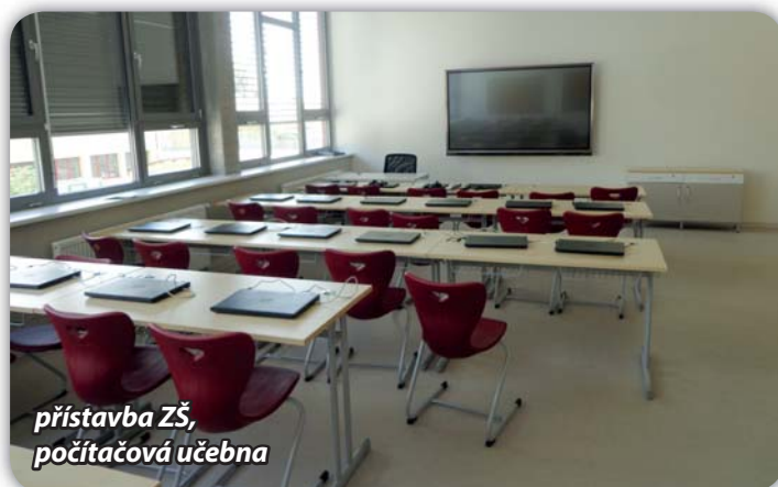
přístavba ZŠ, počítačová učebna

V červenci začne společnost IMOS Brno s výstavbou okružní křižovatky. Financování stavby bude vícezdrojové, stavební objekty, které se týkají krajských komunikací, bude platit Jihomoravský kraj. Opravu ulice Sportovní, stavbu parkovacích míst na téže ulici a odvedení dešťových vod bude financovat město. Jedná se o částku cca 17,5 mil. Kč.