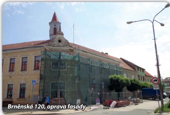
Brněnská 120, oprava fasády