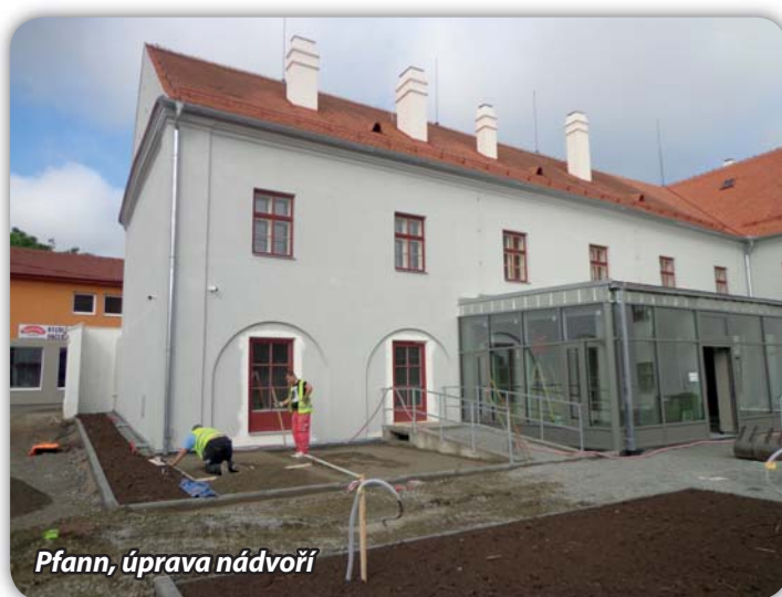
Pfann, úprava nádvoří