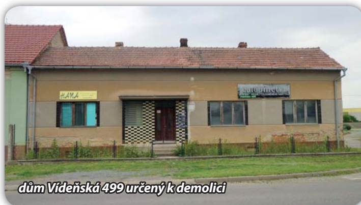
dům Vídeňská 499 určený k demolici