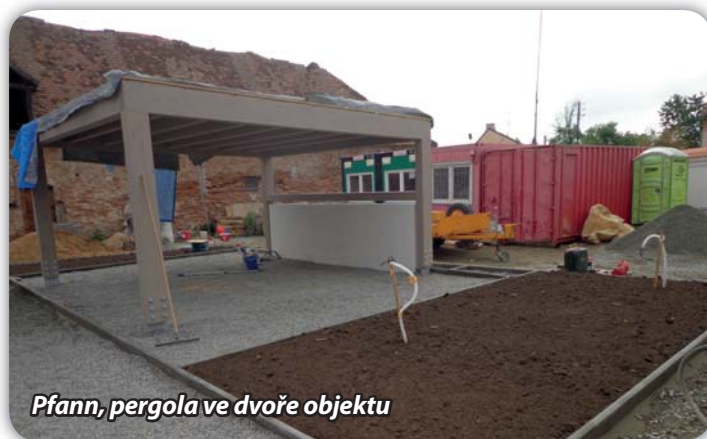
Pfann, pergola ve dvoře objektu