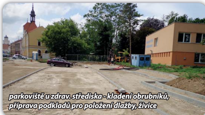
parkoviště u zdrav. střediska - kladení obrubníků, příprava podkladů pro položení dlažby, živice