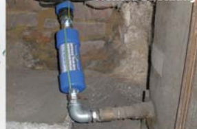
Montáž ze studny