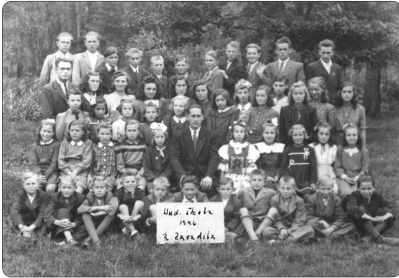
Hudební škola r. 1946