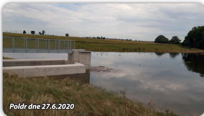
Poldr dne 27.6.2020

Bohužel jsme v květnu t.r. zjistili, že někdo z přelivné-