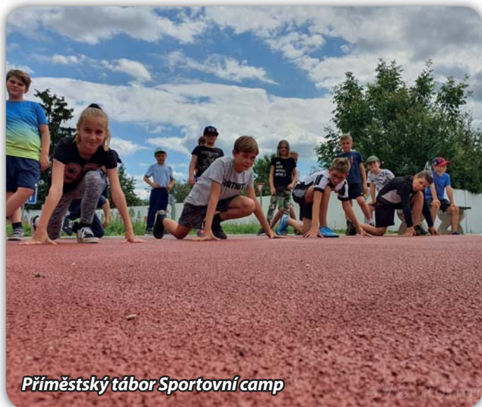
Příměstský tábor Sportovní camp