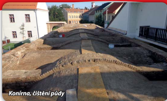
Konírna, čištění půdy