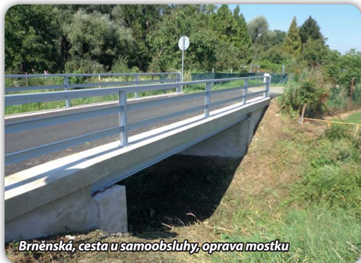
Brněnská, cesta u samoobsluhy, oprava mostku