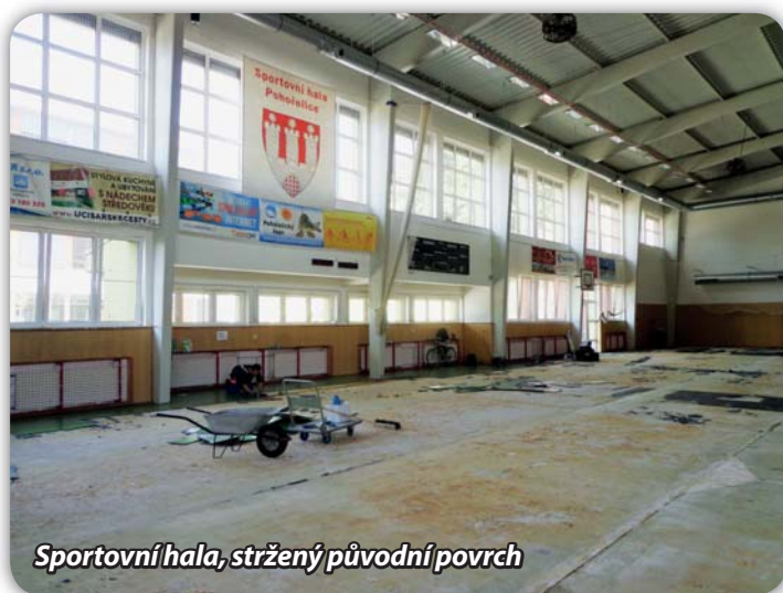
Sportovní hala, stržený původní povrch