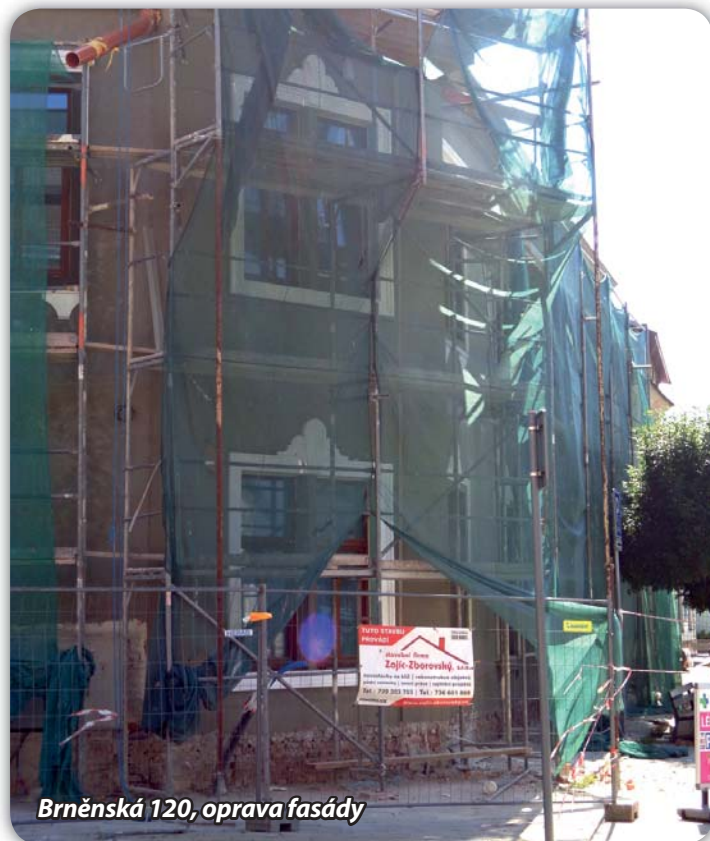
Brněnská 120, oprava fasády

V srpnu t.r. zahájila společnost Silnice Škrob práce vedoucí k postavení přechodu pro chodce v Nové Vsi, v blízkosti bývalé mateřské školy. Práce budou pokračovat i v září, součástí je postavení chodníku od odbočky u Jednoty po odbočku k bývalému mlýnu. Dále zde budou lampy veřejného osvětlení, zúžení vozovky v blízkosti autobusových zastávek a samotný přechod. Již projektování bylo komplikované, bylo třeba zohlednit řadu požadavků dotčených orgánů. Stavba bude stát více než 3 miliony korun.