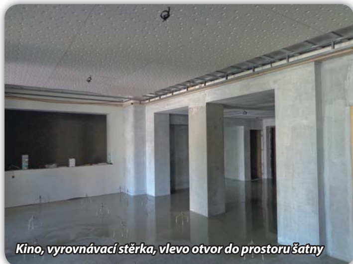
Kino, vyrovnávací stěrka, vlevo otvor do prostoru šatny

Aby mohli členové výše uvedených subjektů využívat nadále plochu hřiště ke své činnosti, došlo mj. k nákupu