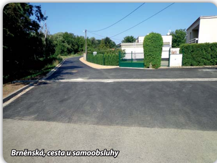
Brněnská, cesta u samoobsluhy