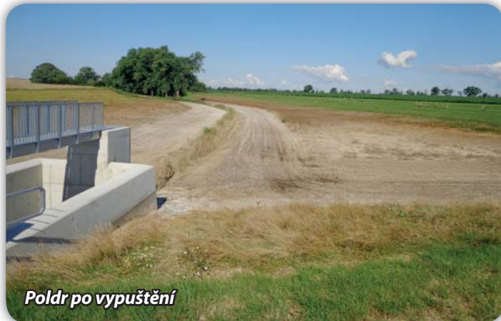
Poldr po vypuštění

Velké poděkování patří pracovníkům Státního pozemkového úřadu v Brně, kteří stavbu poldru „dotáhli“ do