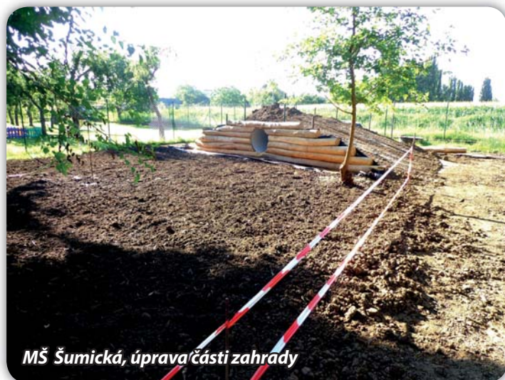
MŠ Šumická, úprava části zahrady

a instalaci sanitárního kontejneru, který umožní úlevu účastníkům, dále kontejneru pro zázemí MášČasBandu. Počítáme rovněž s instalací kontejneru, který by umožnil i skautům tento zajímavý prostor nadále využívat. Skauti se po prázdninách vrátí do nově opravených prostor objektu Pfann. Zde je na dvoře i jedno petangové hřiště, které ale neuspokojí všechny zájemce. Na Šumické je pro hraní petangu k dispozici hřiště víc.