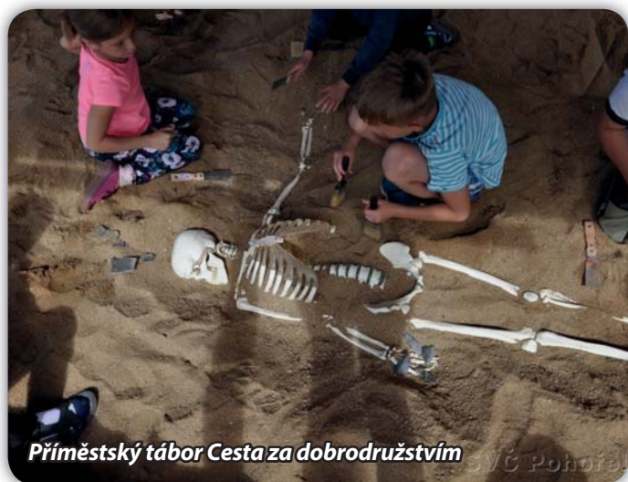
Příměstský tábor Cesta za dobrodružstvím