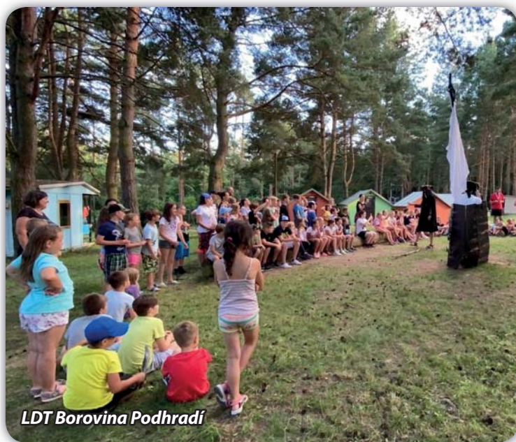
LDT Borovina Podhradí