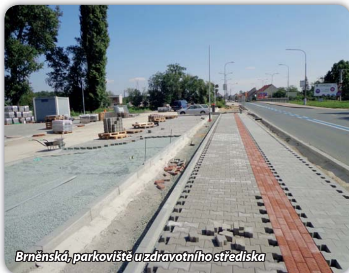
Brněnská, parkoviště u zdravotního střediska

V červenci začala společnost IMOS Brno s výstavbou okružní křižovatky. Financování stavby je vícezdrojové, stavební objekty, které se týkají krajských komunikací, bude hradit Jihomoravský kraj. Opravu ulice Sportovní, stavbu parkovacích míst na těžce ulici a odvedení dešťových vod bude financovat město. Z městských prostředků bude hrazena částka cca 20 mil. Kč. Firma začala frézováním povrchu komunikací, které budou uvnitř oválu okružní křižovatky, budou se dělat přeložky některých inženýrských sítí, přestěhování kapličky.