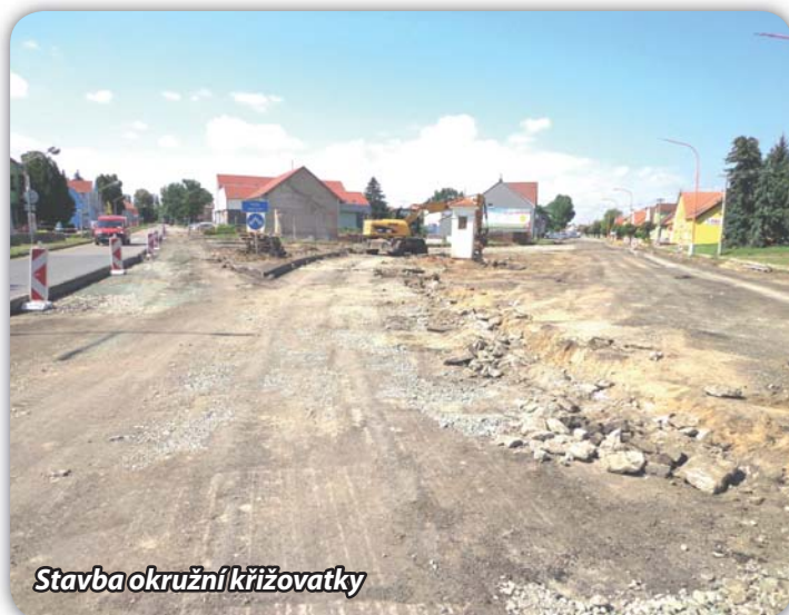
Stavba okružní křižovatky