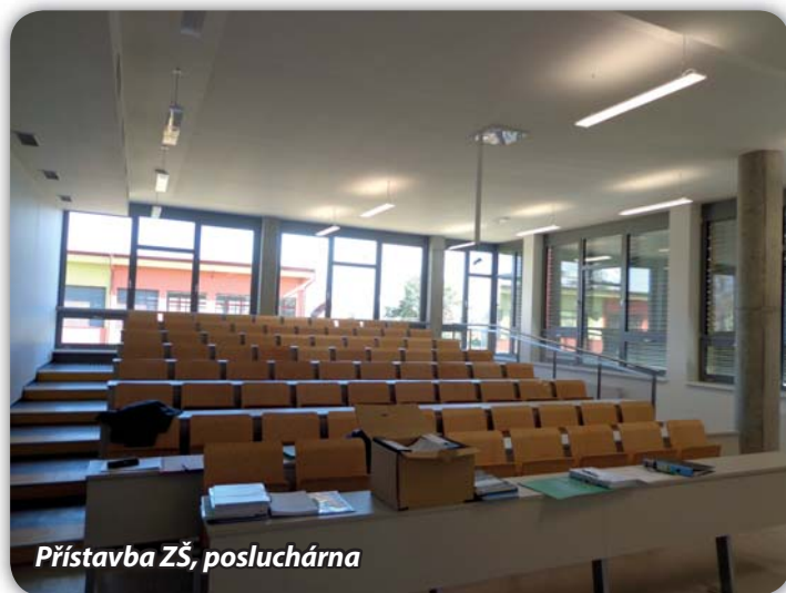
Přístavba ZŠ, posluchárna