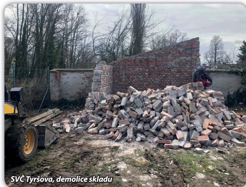
SVČ Tyršova, demolice skladu