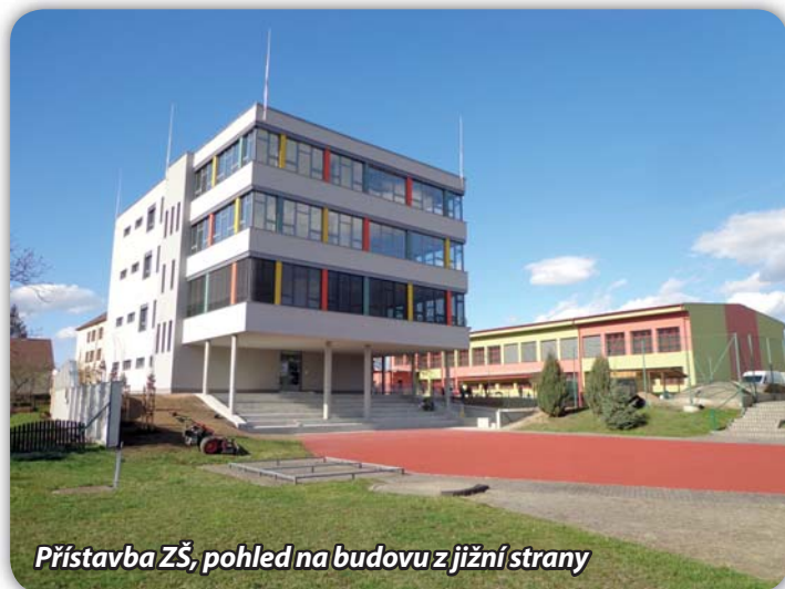
Přístavba ZŠ, pohled na budovu z jižní strany

Dodavatel připravuje prostor pro instalaci výtahu. V budově se temperuje, což umožnilo pracovat i během zimních měsíců. Opravují se omítky uvnitř objektu. Začalo restaurování stropních maleb ve vybraných místnostech. Probíhají jednání s firmou, která bude instalovat vnitřní vybavení.