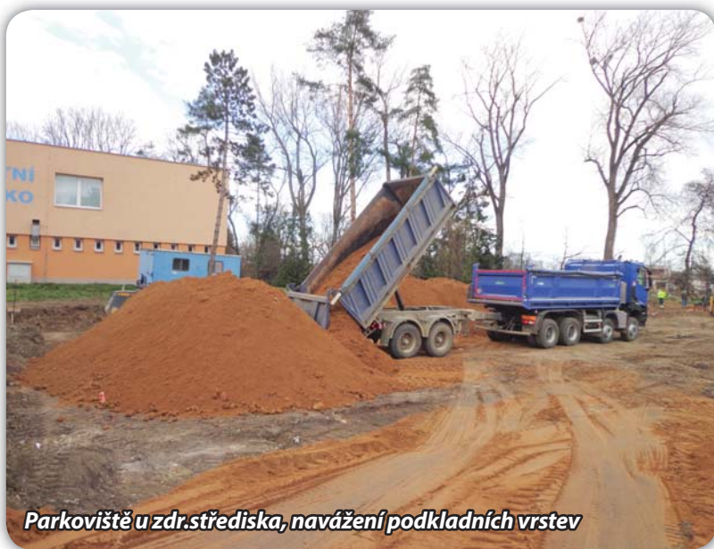
Parkoviště u zdr.střediska, navážení podkladních vrstev