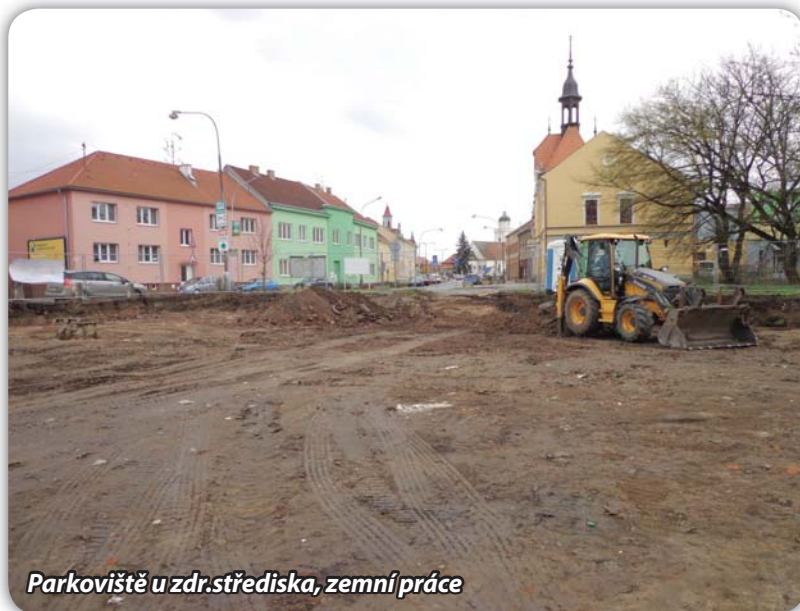
Parkoviště u zdr.střediska, zemní práce