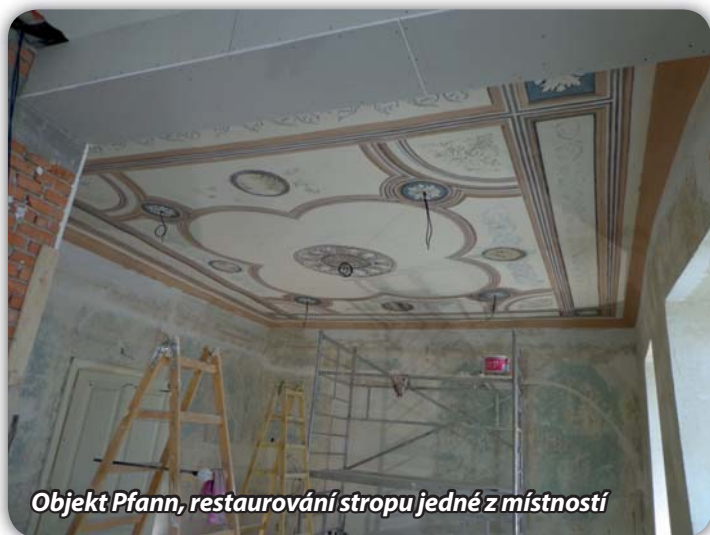
Objekt Pfann, restaurování stropu jedné z místností