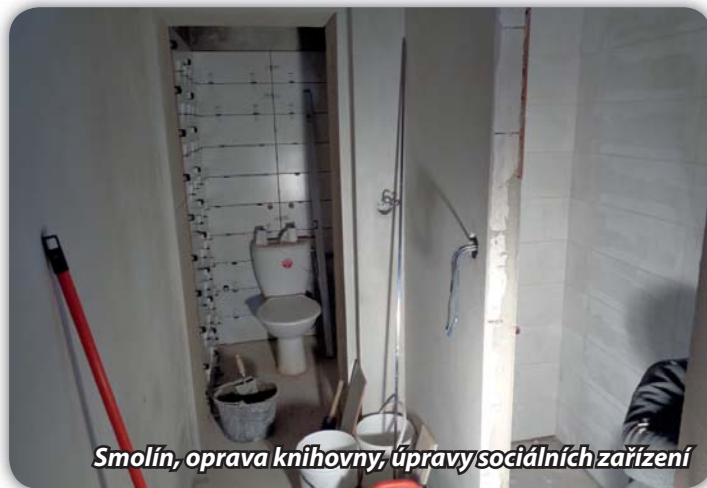
Smolín, oprava knihovny, úpravy sociálních zařízení

Od prosince je opravován objekt knihovny ve Smolíně. Práce provádí firma Nemeš. Součástí prací je zhotovení splaškové kanalizace včetně sociálního zařízení. Firma musela provést opravu statiky v pravé části objektu, dokončila sádkarotonové podhledy, obkládá prostory WC.