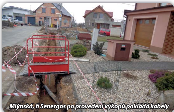
Mlýnská, fi Senergos po provedení výkopů pokládá kabely