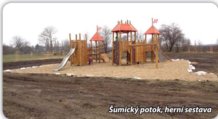
Šumický potok, herní sestava