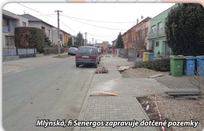
Mlýnská, fi Senergos zapravuje dotčené pozemky