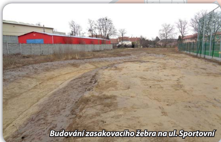
Budování zasakovacího žebra na ul. Sportovní

V červenci 2020 začala společnost IMOS Brno s výstavbou okružní křižovatky. Stavební objekty, které hradil Jihomoravský kraj, byly v prosinci ukončené. Z městských prostředků bude hrazena částka cca 20 mil. Kč. Od 18.11. je v provozu obchodní dům TESCO, od 14.12. je kruhový objezd využíván motoristy. Firmě zbývá dokončit chodníky kolem objezdu. Pokračují práce na ul. Sportovní (parkovací místa, chodníky, veřejné osvětlení, odvodnění ulice). Dále je třeba upravit místo pro Boží muka a provést vegetační úpravy středového ostrůvku. Kvůli nepříznivému počasí firma po zimní odstavce zatím nezačala práce na chodnících. U Mlýnského náhonu je hotov objekt vyústění dešťové kanalizace, v době vydání Zpravodaje bude hotové i zasakovací žebro.