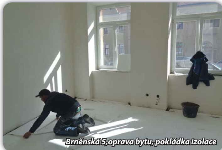
Brněnská 5, oprava bytu, pokládka izolace

Město po uvolnění bytu na Brněnské 5 provádí jeho opravu.