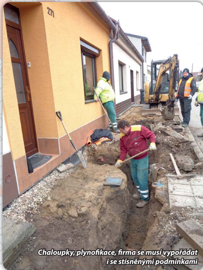
Chaloupky, plynofikace, firma se musí vypořádat i se stísněnými podmínkami

Smlouva byla podepsána se společností Hutira z Ivančic. Práce byly zahájeny začátkem března. Zařízení staveniště je na konci ulice Poříčí. Při hloubení výkopů na ulici Lázeňská bylo zjištěno, že stávající sítě jsou uloženy s mírnou odchylkou od výtýčení. Z toho důvodu je třeba v některých úsecích změnit trasu plynovodního řadu. Znamená to upravit projekt, projednat změny, položit plynovod na jiné místo (třeba i do vozovky) a dotčený povrch zapravit.