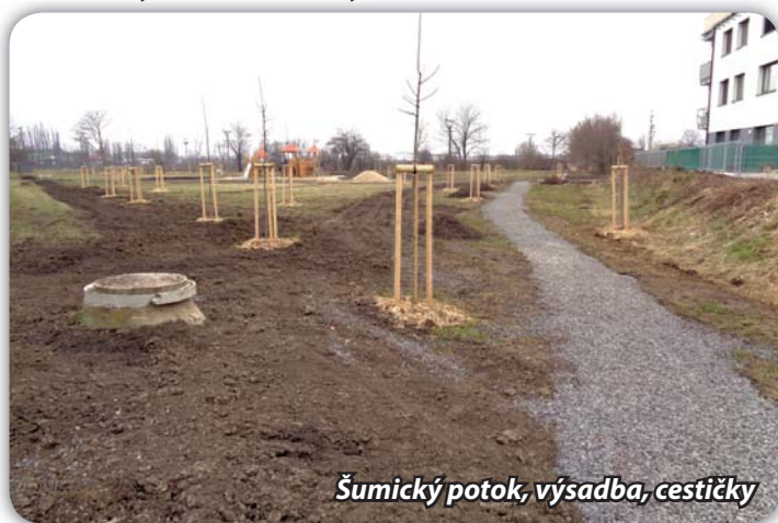
Šumický potok, výsadba, cestičky

V prostoru podél Šumického potoka, v místech mezi ul. Znojemskou a bývalými kasárnami, vysadila společnost Kavyl 92 stromů a přes 260 keřů. Plocha byla doplněna herními prvky. Došlo k podstatnému zlepšení možností trávení volného času pro rodiče s malými dětmi v této části města. Herní sestava byla smontována, na vyčleněný pozemek byl navezen drobný kačírek (oblázky).