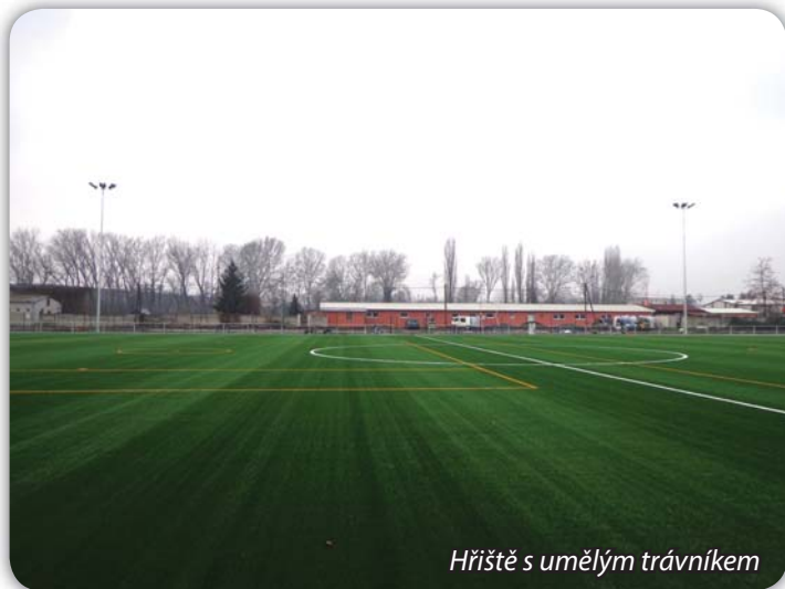
Hřiště s umělým trávnikem

Společnost Prostavby skončila stavbu hřiště s umělým trávnikem v těsné blízkosti stávajícího fotbalového areálu. Koncem ledna bylo hřiště představeno veřejnosti. Již od prosince sportovci hrají na hřišti fotbal.