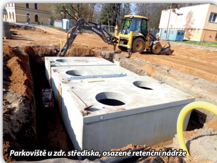
Parkoviště u zdr. střediska, osazené retenční nádrže