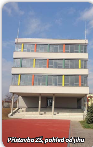
Přístavba ZŠ, pohled od jihu

Dodavatel připravuje prostor pro instalaci výtahu. Opravují se omítky uvnitř objektu. Pokračují práce na restaurování stropních maleb ve vybraných místnostech. Probíhají jednání s firmou, která bude dodávat nábytek.