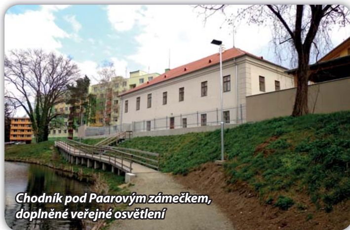
Chodník pod Paarovým zámečkem, doplněné veřejné osvětlení