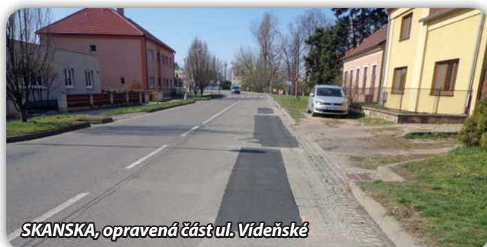
SKANSKA, opravená část ul. Vídeňské