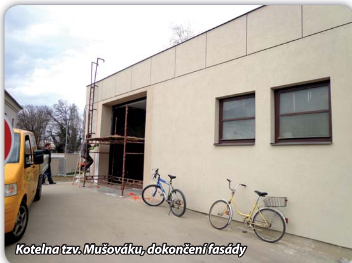
Kotelna tzv. Mušovák, dokončení fasády