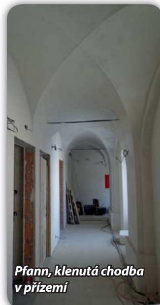
Pfann, klenutá chodba v přízemí