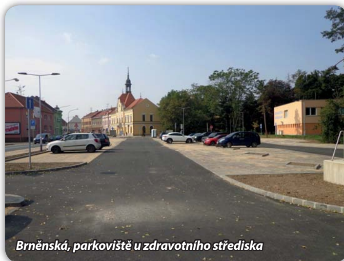
Brněnská, parkoviště u zdravotního střediska

Práce provede na podzim firma Inženýrské stavby Hodonín. Bude se jednat o živичný povrch od ul. Mlýnské k vodoteči směr ul. Na Hrázkách a úpravu propustku přes vodoteč. Vlastníci tří rodinných domků z nové výstavby budou