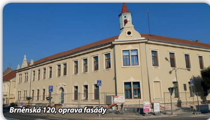
Brněnská 120, oprava fasády

mít lepší přístup k domům, budou si moci naplánovat zpevnění části svých pozemků a napojení na komunikaci. Trvale se odstraní prašnost v tomto úseku cesty.