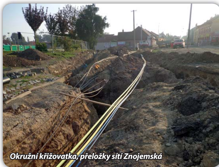
Okružní křižovatka, přeložky sítí Znojemska