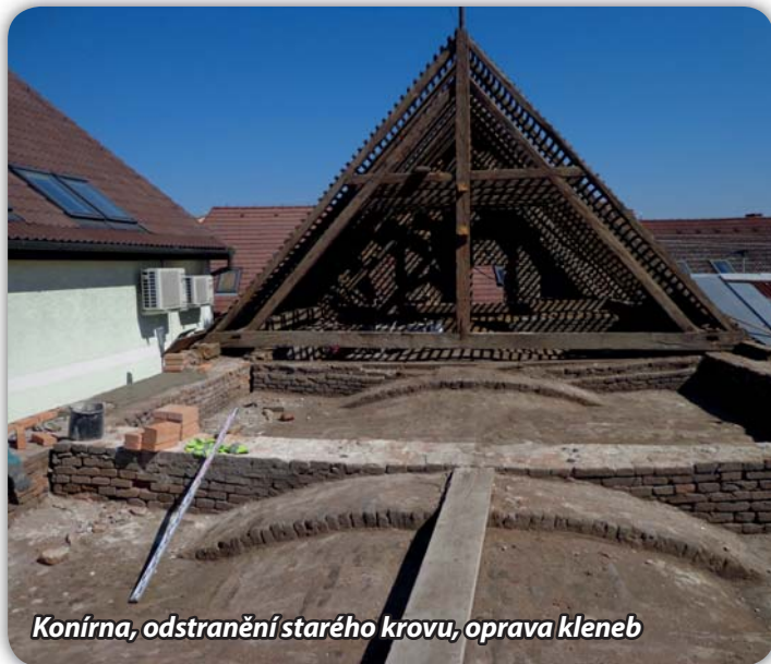
Konírna, odstranění starého krovu, oprava kleneb