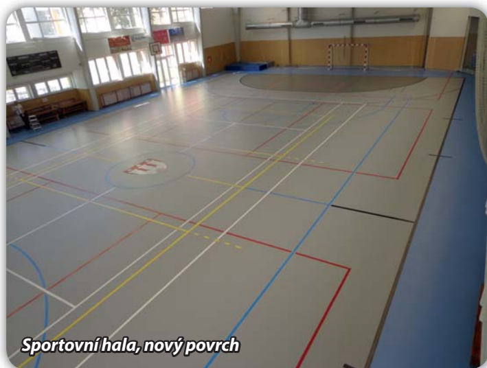
Sportovní hala, nový povrch