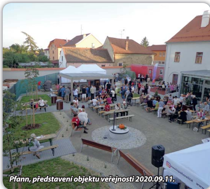
Pfann, představení objektu veřejnosti 2020.09.11.

teřské centrum, klub Pfann, OU Cvrčovice, skauti, Charita, psychologická poradna), aby se jim v opravených prostorech líbilo a mohli zde provozovat svou činnost. Stavební úpravy a pořízení vnitřního vybavení stály cca 73 milionů korun. Z této částky jsme získali 40,5 mil. Kč dotaci z prostředků Evropské unie, Evropského fondu pro regionální rozvoj, Integrovaného regionálního operačního programu.