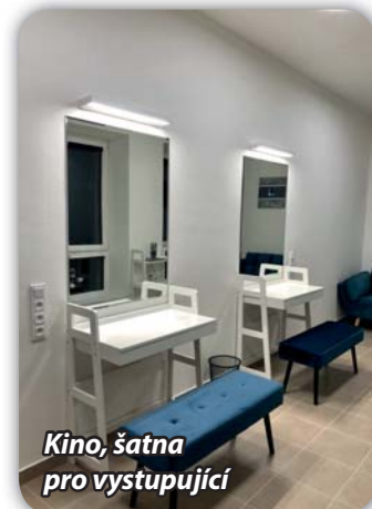
Kino, šatna pro vystupující