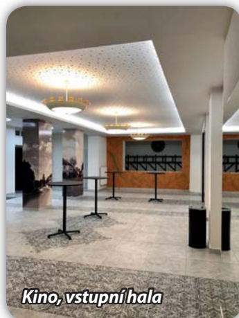
Kino, vstupní hala

Představení opraveného objektu proběhlo ve dnech 11. a 12. září. V pátek odpoledne byl objekt slavnostně předán uživatelům za účasti několika set občanů. Přítomní využili možnost prohlédnout si zrekonstruované prostory. V sobotu 12. září areál Pfannu uvítal návštěvníky „Dne zdraví“. Přejeme všem uživatelům objektu (klub seniorů, SVČ-ma-