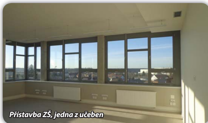
Přístavba ZŠ, jedna z učeben