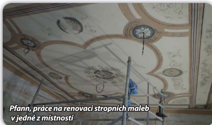
Pfann, práce na renovaci stropních maleb v jedné z místností