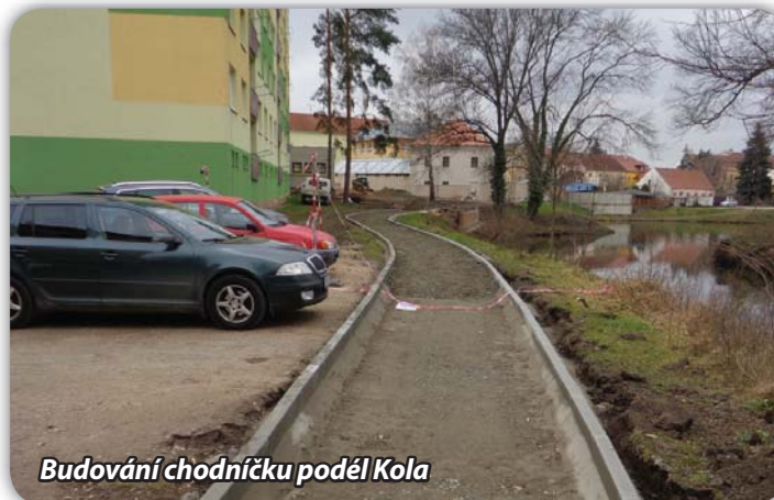
Budování chodníčku podél Kola