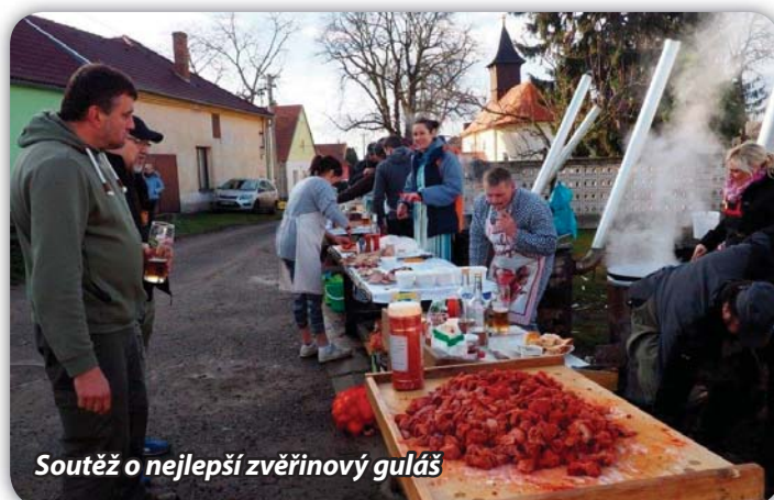
Soutěž o nejlepší zvěřinový guláš