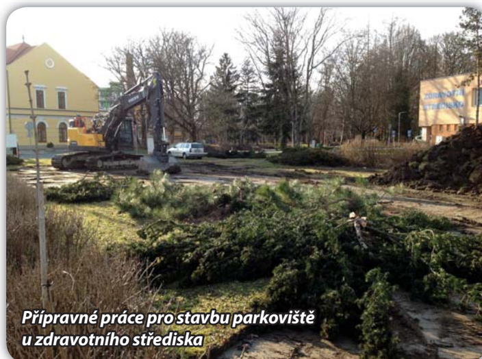
Přípravné práce pro stavbu parkoviště u zdravotního střediska