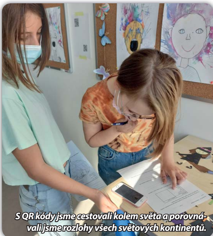
S QR kódy jsme cestovali kolem světa a porovnávali jsme rozlohy všech světových kontinentů.