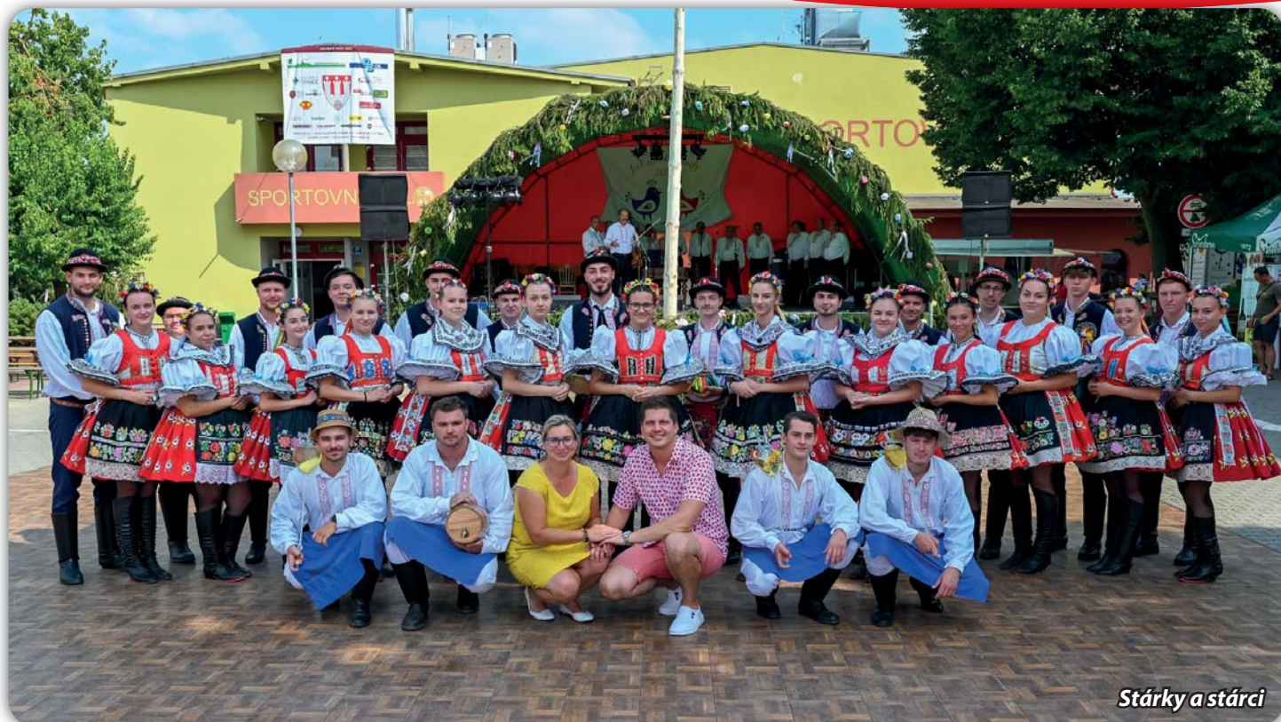
Stárky a stárcei