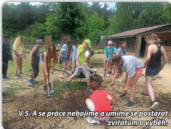
V 5. A se práce nebojíme a umíme se postarat zvířatům o výběh.