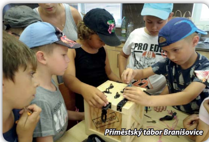
Příměstský tábor Branišovice