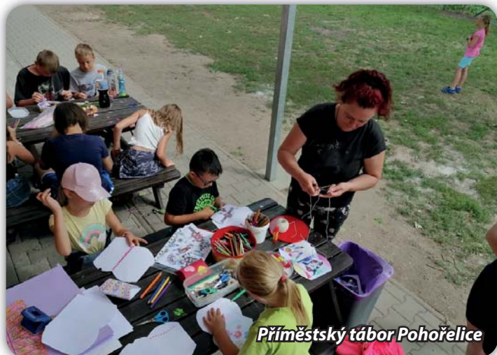
Příměstský tábor Pohořelice