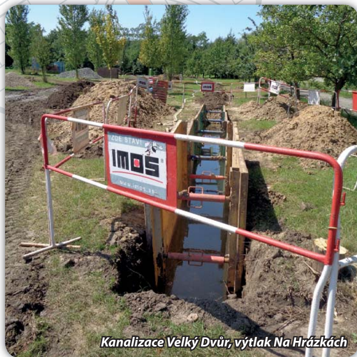
Kanalizace Velký Dvůr, výtlačk Na Hrázčkách

milionů Kč), město hradí zbytek akce (předběžně cca 15 milionů Kč) a zpracovanou projektovou dokumentaci. Výběr zhotovitele proběhl, práce bude provádět společnost IMOS. Stavba začala v červnu 2021, trvat bude asi 1 rok. Splaškové vody z Velkého Dvora budou výtlačkem dopravovány na ulici Mlýnskou, pak potočou gravitačně na ČOV. Firma začala práce budováním části výtlačku – od dálnice po ulici Mlýnskou. Problémy dělá vysoký stav spodní vody, kdy je nutno vodu ve výkopu odčerpávat.