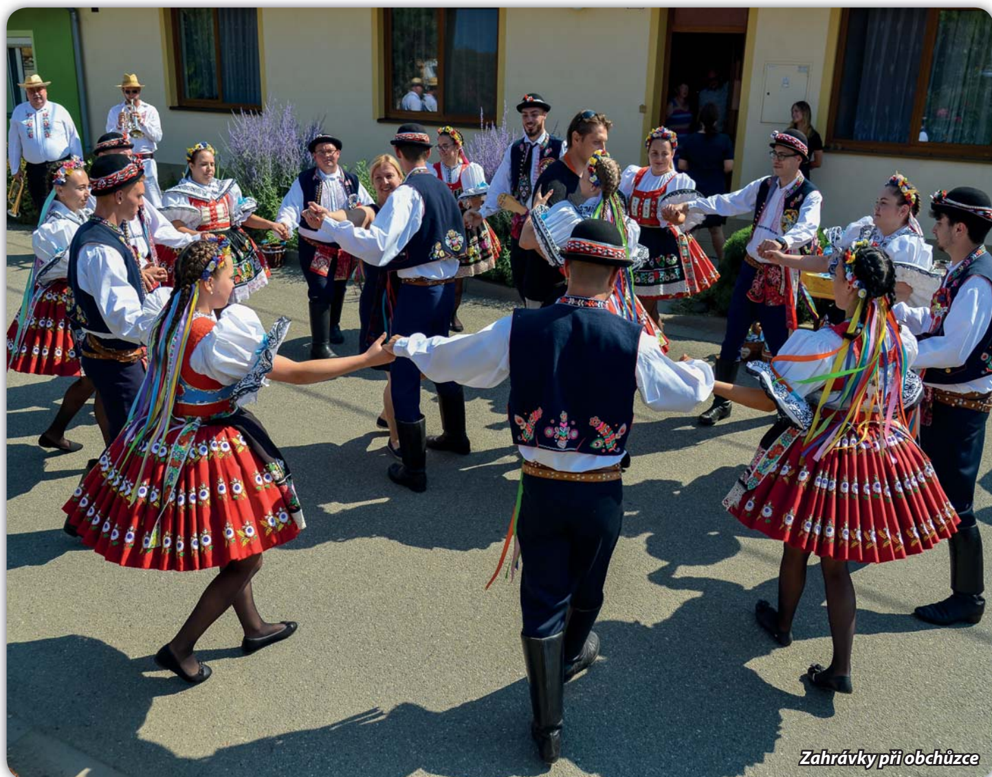
Zahrávky při obchůzce