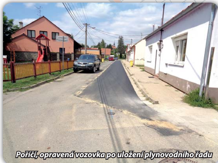
Poříčí, opravená vozovka po uložení plynovodního řádu

Společnost Hutira z Ivančic dokončila plynofikaci v červnu t.r. Po vydání kolaudačního souhlasu a uzavření smlouvy s plynárnami na pronájem plynovodu (zařizují plynárny a nemáme v podstatě možnost to časově ovlivnit) bude možné vpustit do nově postavených rozvodů plyn. Po propojení na rozvody plynu budou moci zájemci připravovat vnitřní rozvody v rodinných domech.