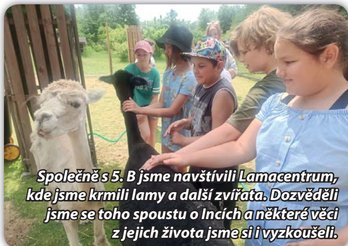
Společně s 5. B jsme navštívili Lamacentrum, kde jsme krmili lamy a další zvířata. Dozvěděli jsme se toho spoustu o Incích a některé věci z jejich života jsme si i vyzkoušeli.