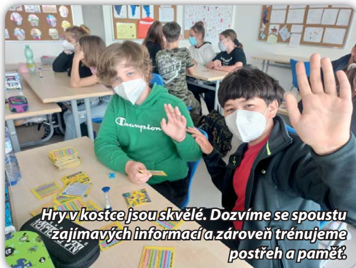
Hry v kostce jsou skvělé. Dozvíme se spoustu zajímavých informací a zároveň trénujeme postřeh a paměť.