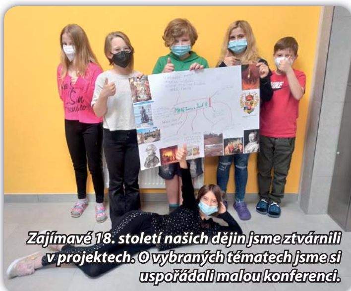
Zajímavé 18. století našich dějin jsme ztvárnili v projektech. O vybraných tématech jsme si uspořádali malou konferenci.