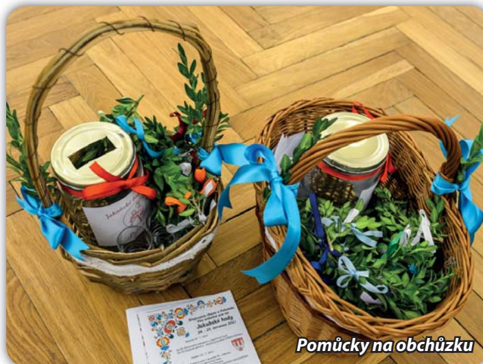
Pomůcky na obchůzku