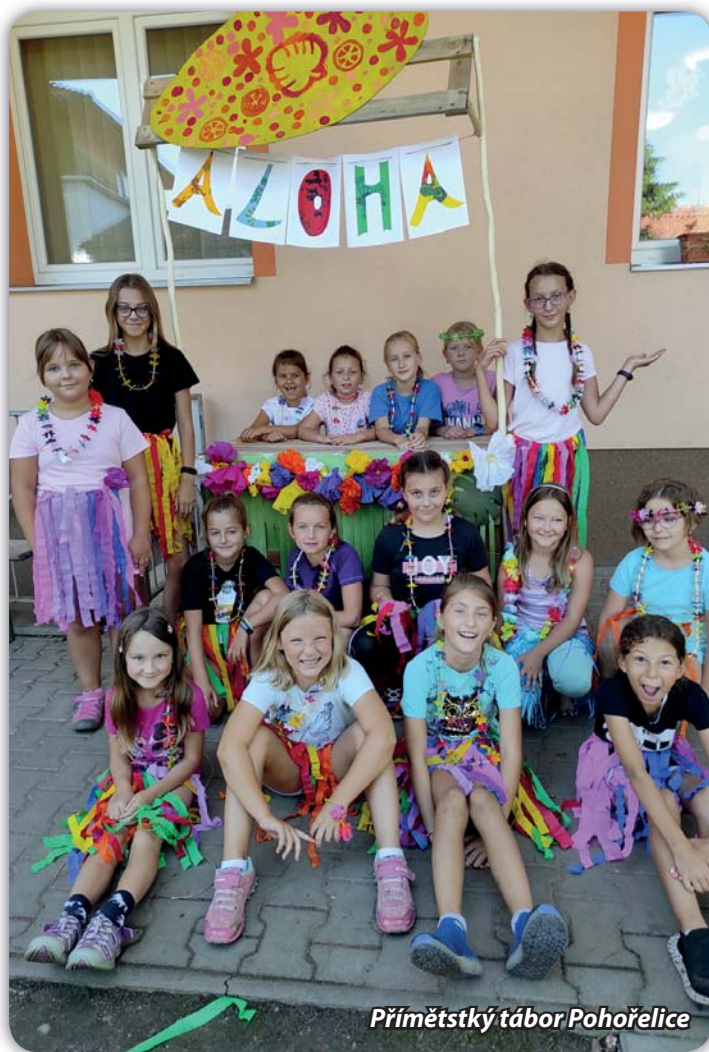
Příměstský tábor Pohořelice