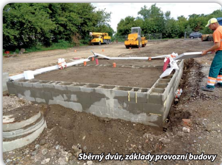
Sběrný dvůr, základy provozní budovy

Stavbu provádí společnost SET stavby. Předpokládáme, že sběrný dvůr bude hotov cca za rok.