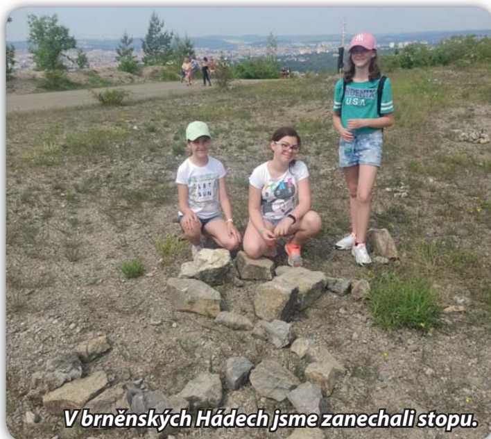
V brněnských Hádech jsme zanechali stopu.