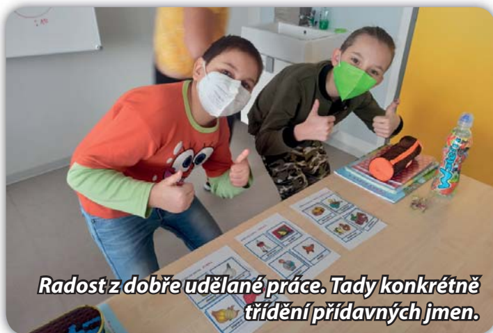
Radost z dobře udělané práce. Tady konkrétně třídění přídavných jmen.