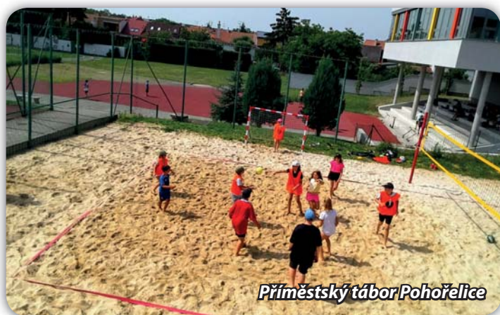
Příměstský tábor Pohořelice