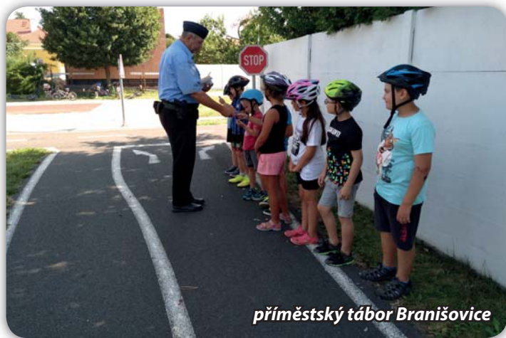
příměstský tábor Branišovice