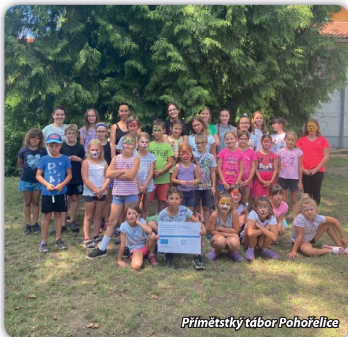
Příměstský tábor Pohořelice