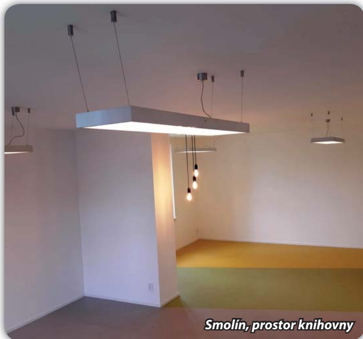
Smolín, prostor knihovny

Od prosince je opravován objekt knihovny ve Smolíně. Stavba byla převzata. Koncem srpna budou místnosti zařízeny nábytkem a dalším vybavením.