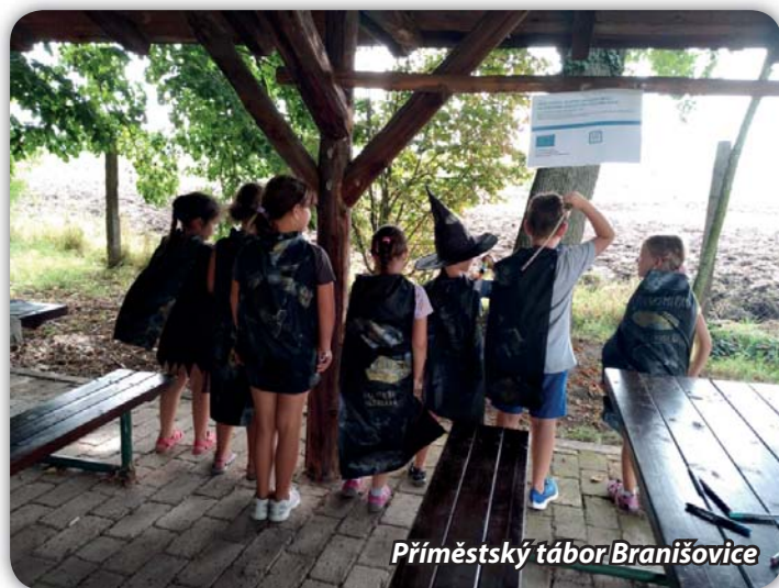
Příměstský tábor Branišovice