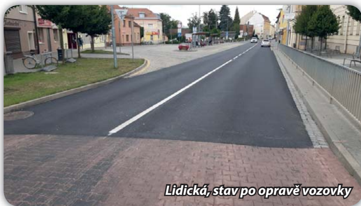
Lidická, stav po opravě vozovky

Správa a údržba silnic zajistila v červenci opravu vozovky na Lidické, a to od mostu přes Mlýnský náhon po přechod pro chodce u kostela. Při provádění prací byla po určitou dobu vyloučena v tomto úseku doprava, jezdilo se přes Velký Dvůr, stanoviště autobusů byla po dobu oprav přesunuta na ul. Cukrovarskou. V tomto úseku byl položen druh živice, která by měla být odolnější vůči vyjíždění kolejí.