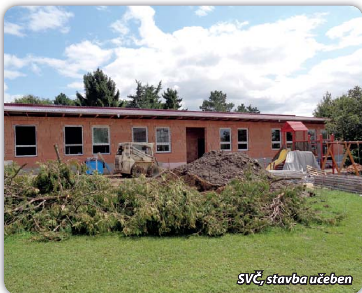
SVČ, stavba učeben

V červnu byla zahájena výstavba 2 učeben pro mimoškolní aktivity v areálu SVČ na Dlouhé ulici. Stavbu provádí společnost STAVIKA z Břeclavi. Dokončení stavby předpokládáme do konce roku. Investiční náklady budou činit cca 6,5 milionů Kč, z toho asi 2,7 mil. Kč pokryje dotace získaná prostřednictvím Místní akční skupiny Podbrněnsko.