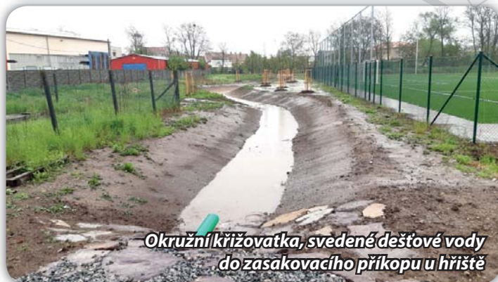
Okružní křižovatka, svedené dešťové vody do zasakovacího příkopu u hřiště