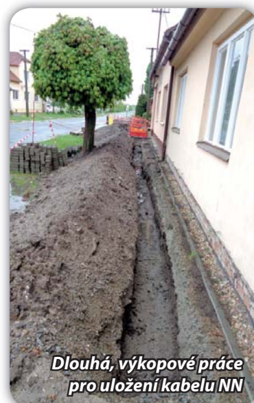
Dlouhá, výkopové práce pro uložení kabelu NN

Společnost EG.D je investorem pokládky kabelu nízkého napětí (NN) v uvedených ulicích. V současné době probíhají závěrečné práce na ul. Mlýnské, dodavatelská firma se postupně přesouvá na Dlouhou. Městu vznikají u této stavby náklady, neboť svítidla veřejného osvětlení (VO) jsou nyní umístěna na betonových sloupech EO.N. Byla zpracována projektová dokumentace a firma současně s pokládkou kabelu EO.N přikládá i kabel VO a dělá přípravu na stavění sloupů VO. Dále firma spolupracuje i se společností, která ukládá do země optický kabel, a bude občanům nabízet kapacitní internetové připojení.