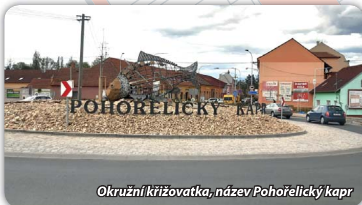
Okružní křižovatka, název Pohořelický kapr

V červenci 2020 začala společnost IMOS Brno s výstavbou okružní křižovatky. Stavební objekty, které hradil Jihomoravský kraj, byly v prosinci ukončeny. Z městských prostředků bude hrazena částka cca 20 mil. Kč. Od 18.11. je v provozu obchodní dům TESCO, od 14.12. je kruhový objezd využíván motoristy. Firma dokončila chodníky kolem objezdu. Na ul. Sportovní jsou práce v podstatě hotové. Je třeba upravit místo pro Boží muka, provést jejich opravu. Vegetační úpravy středového ostrůvku byly provedeny. Dodavatelská firma skončila s pracemi v květnu. Začátkem května byl na vnitřní ovál doplněn nápis „Pohořelický kapr“.