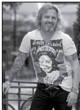
zpracovala Alena Bilavčíková