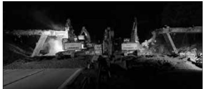
D1 Modernizace - úsek 22 EXIT 162 Velká Bíteš - EXIT 168 Devět Křížů

Mezi další významné dopravní projekty v Jihomoravském kraji bezesporu patří modernizace D1 , konkrétně se jedná o úseky 25 (EXIT 178 Ostrovačice - EXIT 182 Kývalka) a úsek 22 (EXIT 162 Velká Bíteš - EXIT 168 Devět křížů).