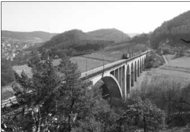
Rekonstrukce koleje č. 2 v km 30,650 - 38,616 tratě Brno - Havlíčkův Brod

Prostřednictvím OPD1 bylo podpořeno 419 projektů, postaveno a zrekonstruováno 319 km dálnic a silnic I. třídy a zmodernizováno 675 km železničních tratí. V Jihomoravském kraji pak bylo prostřednictvím OPD1 realizováno 28 projektů týkajících se dopravy, jejichž prostřednictvím bylo zrekonstruováno 17,45 km železničních tratí a zmodernizováno 54,35 km dálnic a silnic sítě TEN-T . Bližší informace naleznete na webových stránkách www.opd.cz/opd1 .