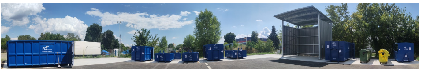
Sběrný dvůr Pohořelice